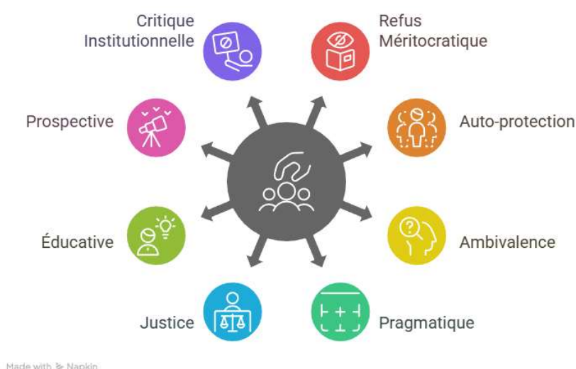
Figure : 2 Postures des élèves face aux IAG

Notre cartographie distingue huit postures principales, non exclusives, mais dominantes selon les cas.