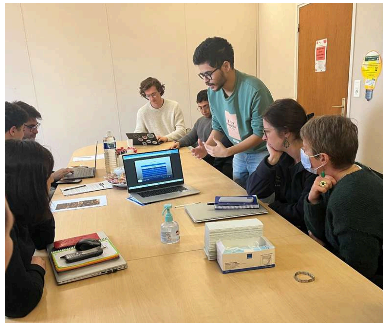
Tests des prototypes par les étudiants, auprès des professionnels des unités protégées - mars 2025

Le Living Lab de l'Hospitalité a missionné des étudiants du défi innovation de l'IMT Atlantique à travers la problématique : « Quels dispositifs d'accompagnement pour renforcer la liberté d'aller et venir des résidents en EHPAD ? ».