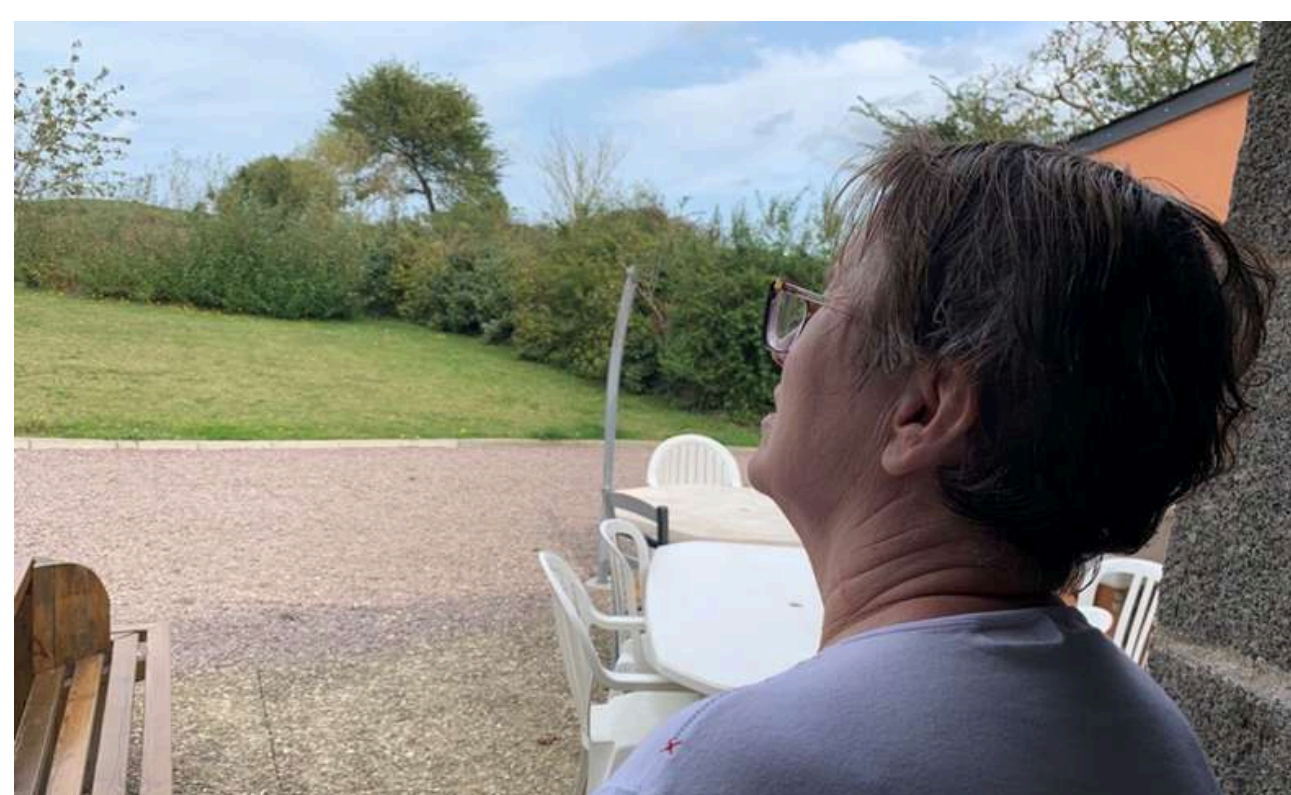
Expérimentation en condition réelle - octobre 2023

► Partenariat d'enseignement et de recherche : soutenir les projets d'innovation des étudiants et concevoir des projets de recherche industriels.