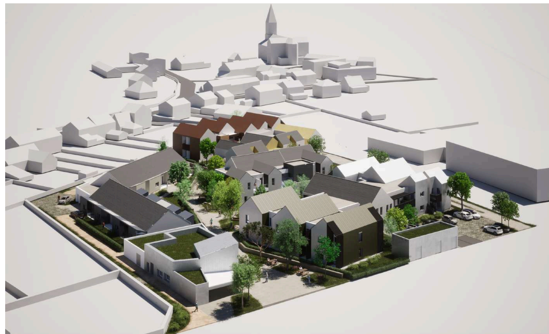
Esquisse du projet architectural du futur quartier réalisé par le cabinet d'architecte ADA - octobre 2024