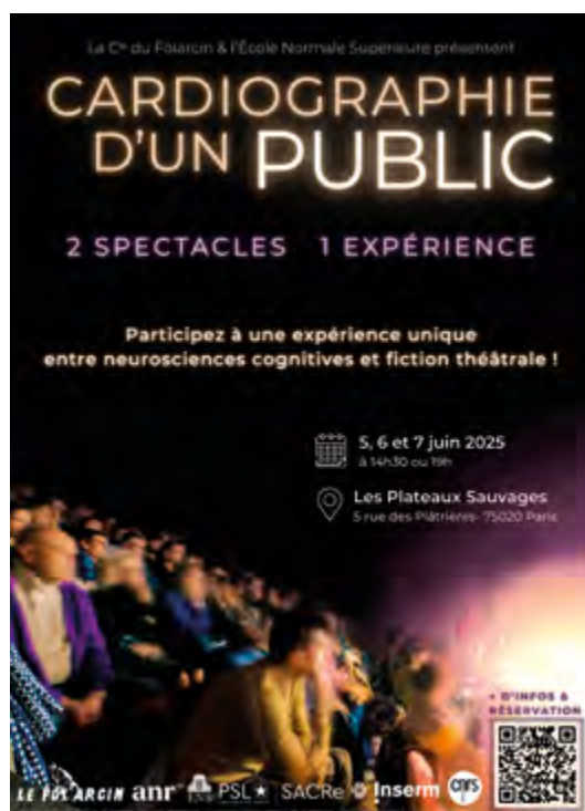
Affiche du spectacle-expérience Cardiographie d'un public , Paris, 2025.

Comment nos institutions de recherche et de culture accueillent-elles (ou non) l'indiscipline?