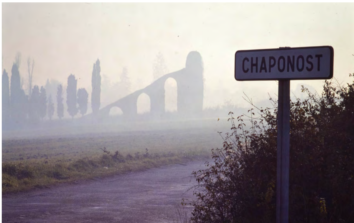
Plat de l'Air, Chaponost (Rhône). Vue en arrière-plan du rampant du siphon inversé de l'Yzeron de l'aqueduc du Gier.

Le colloque s'est clos avec une excursion commentée d'une demi-journée