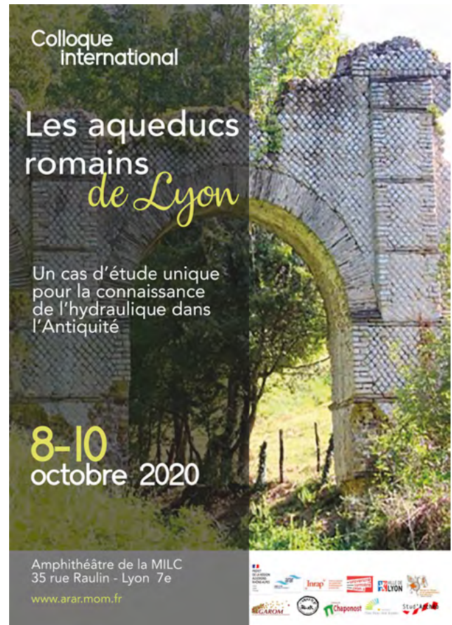
Affiche du colloque d'octobre 2020 (conception C. Develay, service Communication MOM).

travaux universitaires, prospections pédestres indépendantes, programmes de gestion patrimoniale visant à la préservation et à l'étude des canaux). Si le moteur de cette assemblée était de créer un cadre favorable à un exposé cohérent et collégial, celui-ci se voulait également ouvert à tous. Il s'agissait aussi de communiquer un état de la recherche touchant un patrimoine commun – ici celui des aqueducs lyonnais, un thème prisé par de nombreux publics. La ville romaine de Lyon- Lugdunum bénéficie en effet d'un réseau d'adduction d'eau particulièrement développé à l'échelle de l'Empire. Quatre longs aqueducs totalisant plus de 200 km linéaires de canaux, et puisant l'eau dans un rayon pouvant atteindre 40 km, desservent la colline de Fourvière, cœur de la ville antique. Il s'agit, du nord au sud, des aqueducs du mont d'Or, de la Brévenne, de l'Yzeron et du Gier. Un cinquième tracé d'ampleur plus modeste, l'aqueduc de Fontanières, a été récemment remis au jour, tandis que plusieurs indices suggèrent que d'autres parcours de portée similaire à ce dernier pourraient encore être mis en lumière. Tous