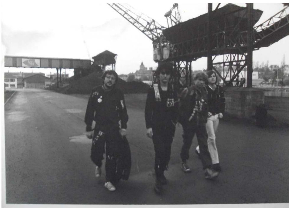
Bye Bye Turbin