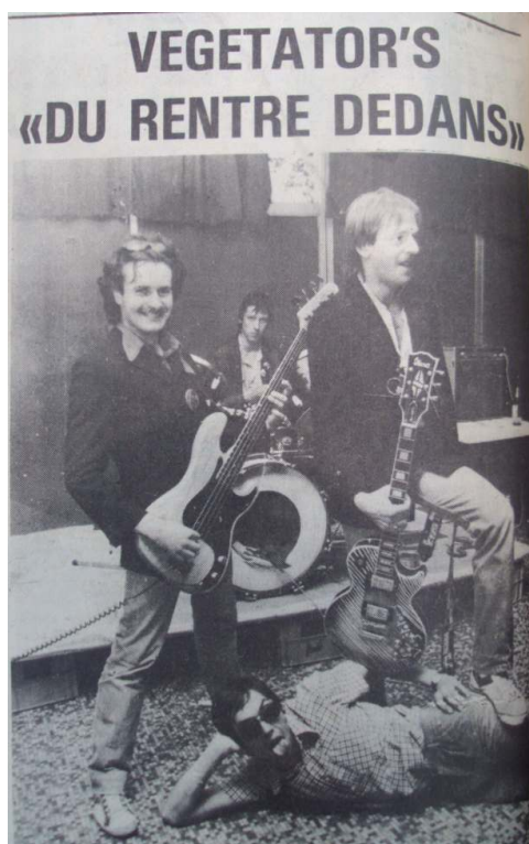
Le Pays d'Auge , 6 juin 1978