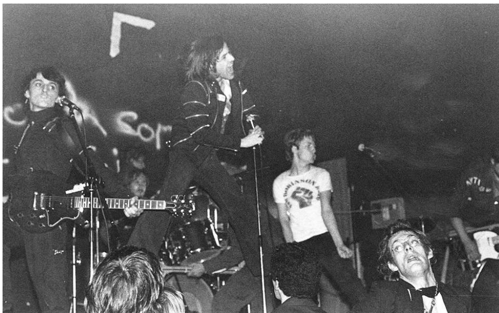
Concert à la MJC d'Hérouville Saint-Clair, 1978