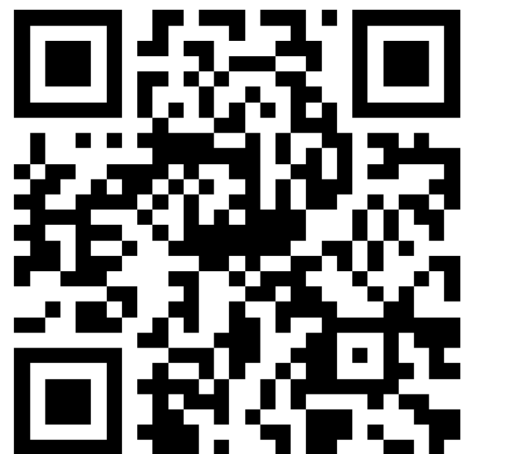
Corpus théâtral parallèle pour l'alsacien