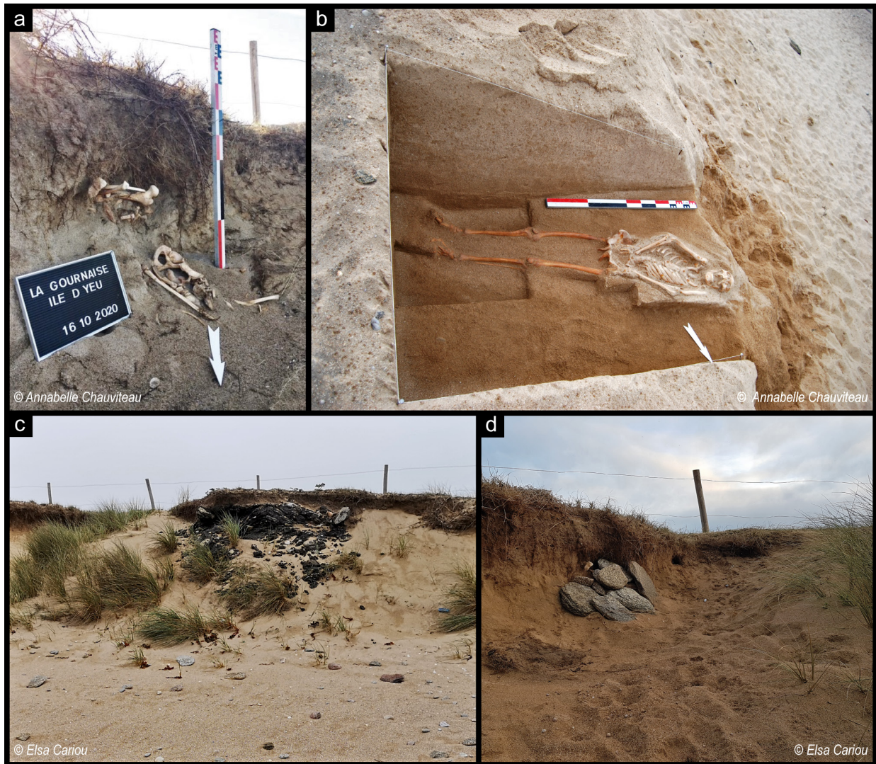
Fig. 2 – a) Inhumation n° 18-2020, Pointe de la Gournaise, Île d'Yeu (Vendée, France) ; b) Inhumation n° 15-2016, sondage archéologique, Pointe de La Gournaise ; c) Pétrole du Torrey Canyon, actuellement en érosion avec la dune ; d) Chemin non-autorisé à la plage, fréquenté par les hommes et les chiens (empreintes). Sur la gauche du cliché, les pierres disposées après la collecte des os masquent en partie l'inhumation illustrée en (a).