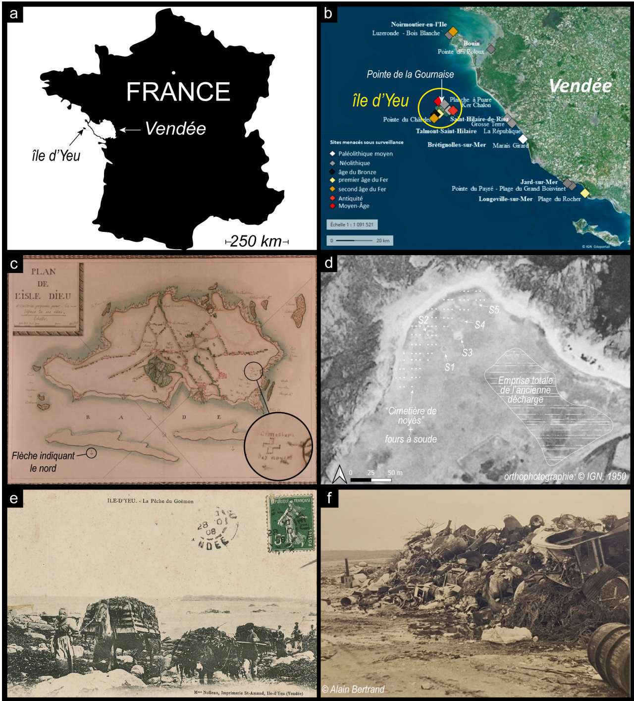
Fig. 1 – a) Situation géographique de l'étude ; b) Sites archéologiques côtiers menacés et sous surveillance archéologique en Vendée ; c) Carte annexée à un rapport daté de mars 1796, envoyée par le Général républicain Tristan-Brisson au citoyen Letourneur, Président du Directoire. Archives du Génie (SHAT. MR 1232), Château de Vincennes ; d) Photographie aérienne de la Pointe de la Gournaise en 1950, Île d'Yeu (Vendée, France) et position sur site des différents types de structure d'origine humaine : S1 à S5 marquent la position des structures circulaires encore indéterminées, explorées au géoradar ; e) Le transport des algues, au premier plan une jeune femme, plage du Loubinou (adjacente à la plage de la Gournaise), Île d'Yeu (Vendée, France), carte postale, photo M. Dérotrie, fonds F. Corbineau, service patrimoine, mairie de l'Île d'Yeu ; f) Décharge à ciel ouvert de la Gournaise, années 70.