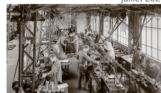
Enseigner par l'atelier 2