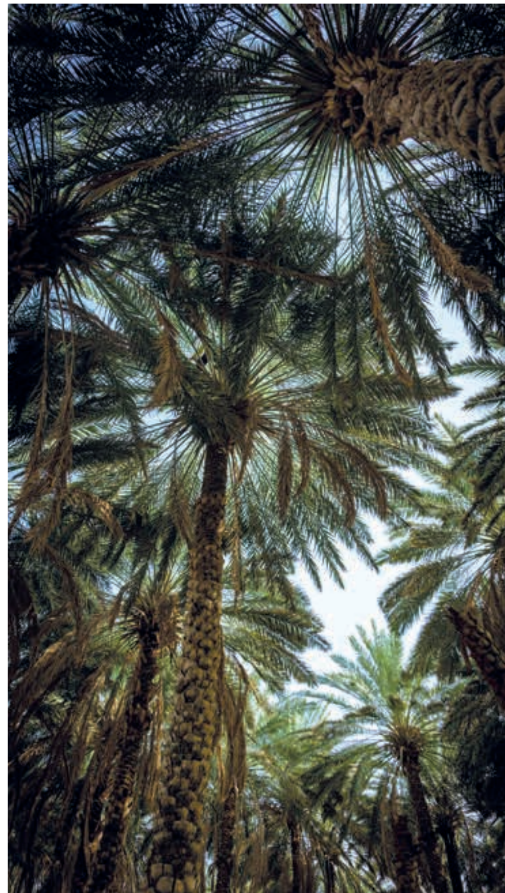
图 10， 埃尔奥拉古老的棕榈林花园中的 椰枣树 (Phoenix dactylifera sp.) 树冠，2020 年。

在此基础上，该项目专注于全面揭示植物与土壤微生物相互作用的功能。植物在每平方米土壤中发展出数千米的根系网络，而微生物则形成可达每克土壤 200 米的微观丝状结构网络。通常情况下，植物根系和丝状结构相互支持：真菌利用土壤资源，以换取植物提供的糖分。这就是埃尔奥拉地区出现了被食客广泛青睐的被称为“沙漠松露”的抱地菇的缘故。深入了解植物在埃尔奥拉的角色为可持续管理提供了重要指标，同时为生态修复提供了有效工具。最后，SoFunLand 团队得到了考古团队的协助，正在试图确定过去人类活动的微生物标志。未来，这些分析可能有助于发现传统考古调查方法未能发现的遗址。