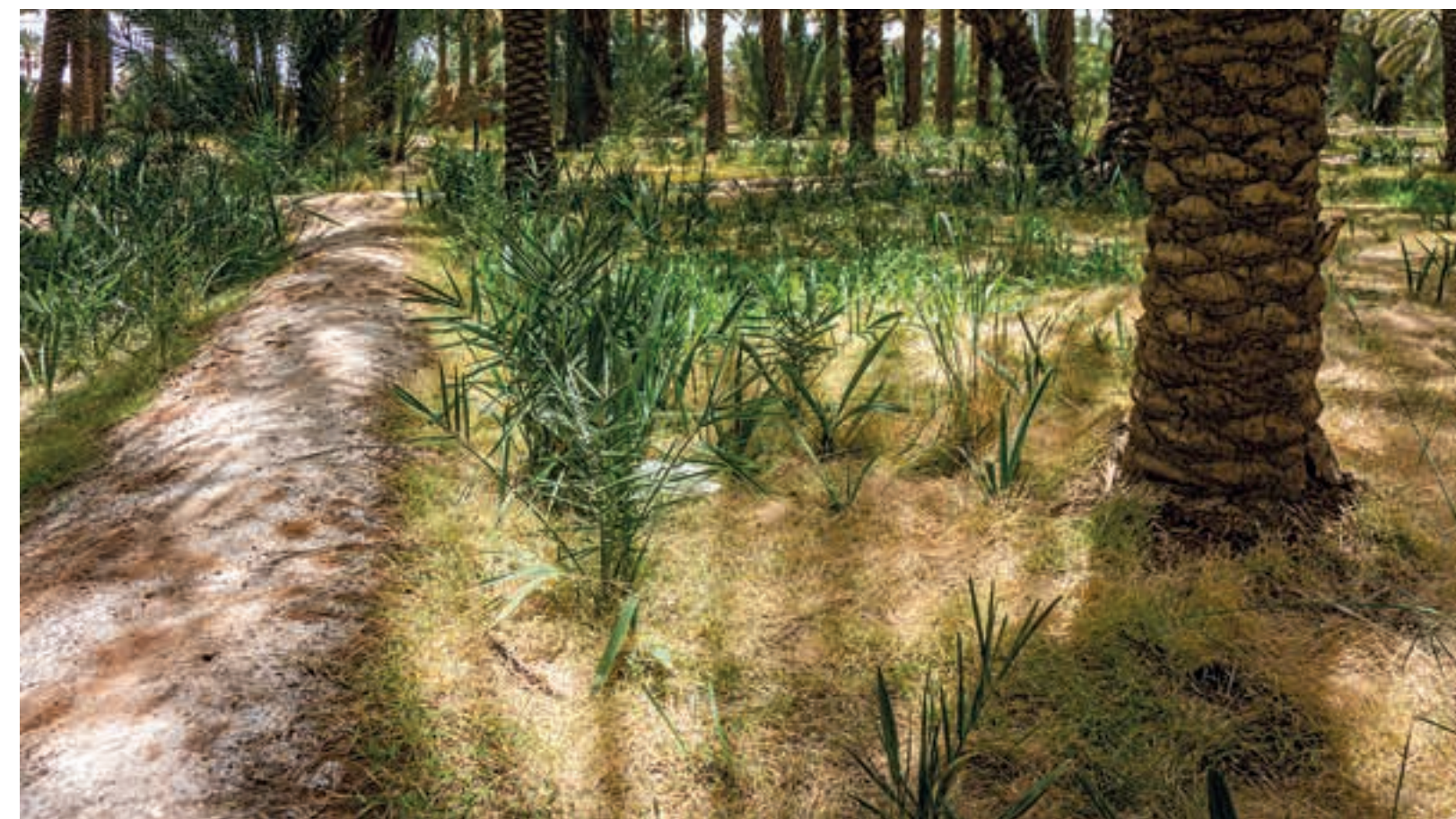
图 12， 花园里偶然生长的椰枣树 (不久后将被移走)， 2020 年。