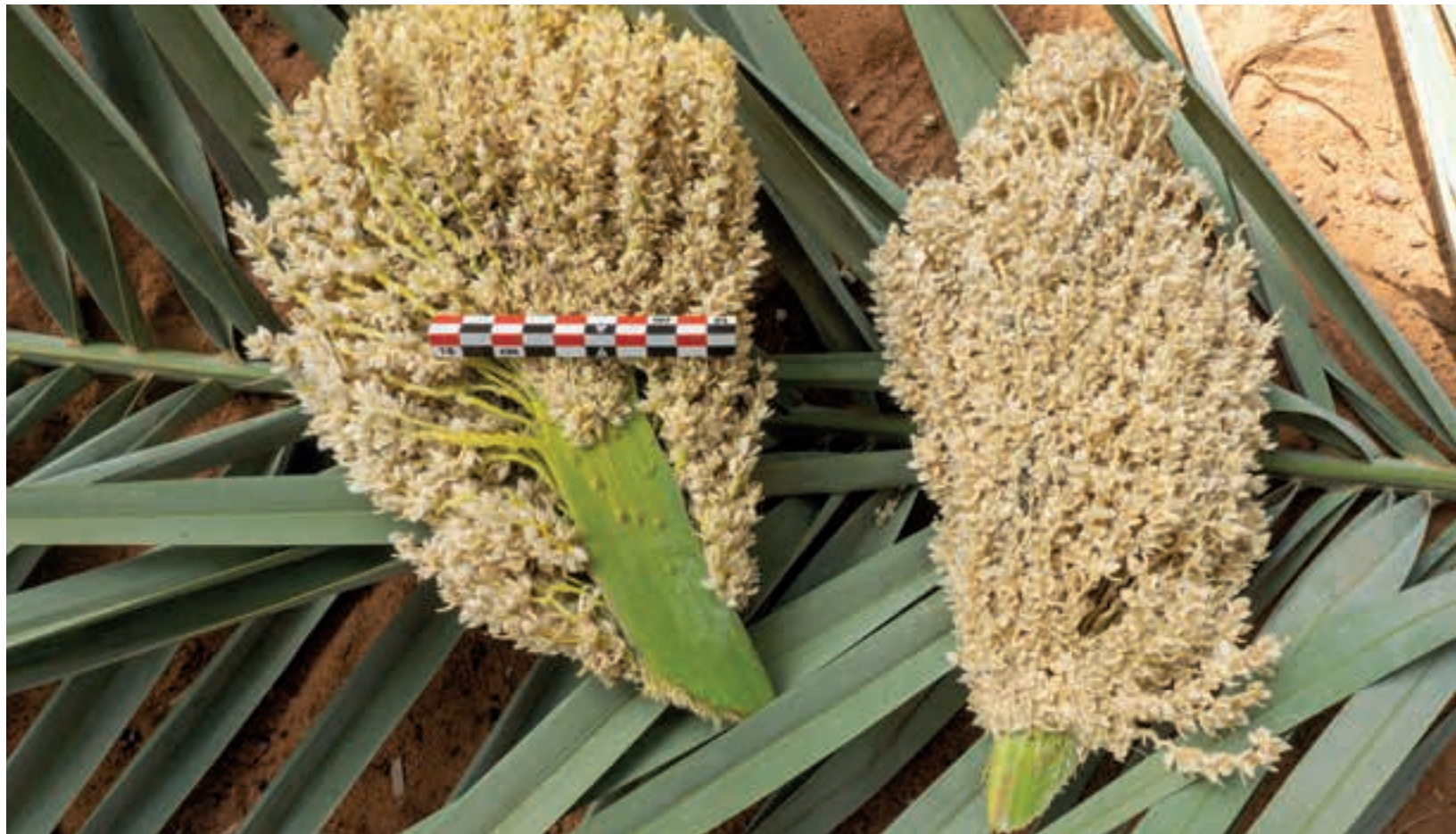
图 13， 通过人工授粉收获的雄性枣椰树花， 2020 年。

定和描述了当地农民种植的 90 多个椰枣品种。如今，最常见的是 barniyy (图11)，其次是 ḥelwah ḥamrā’。