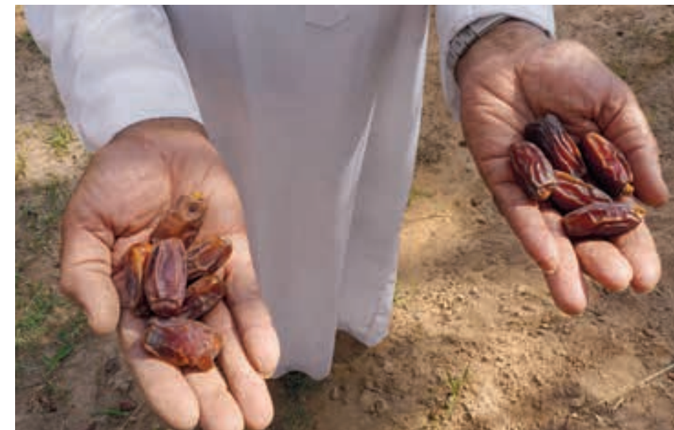
图 11， 埃尔奥拉古老的棕榈树林中，一位定居者手捧两种 barniyy 椰枣：右手是顶级 mabrûm 椰枣，左手则是质量次之的 abû qushayrah (是 mashrûk 和 'âdî 的结合)。