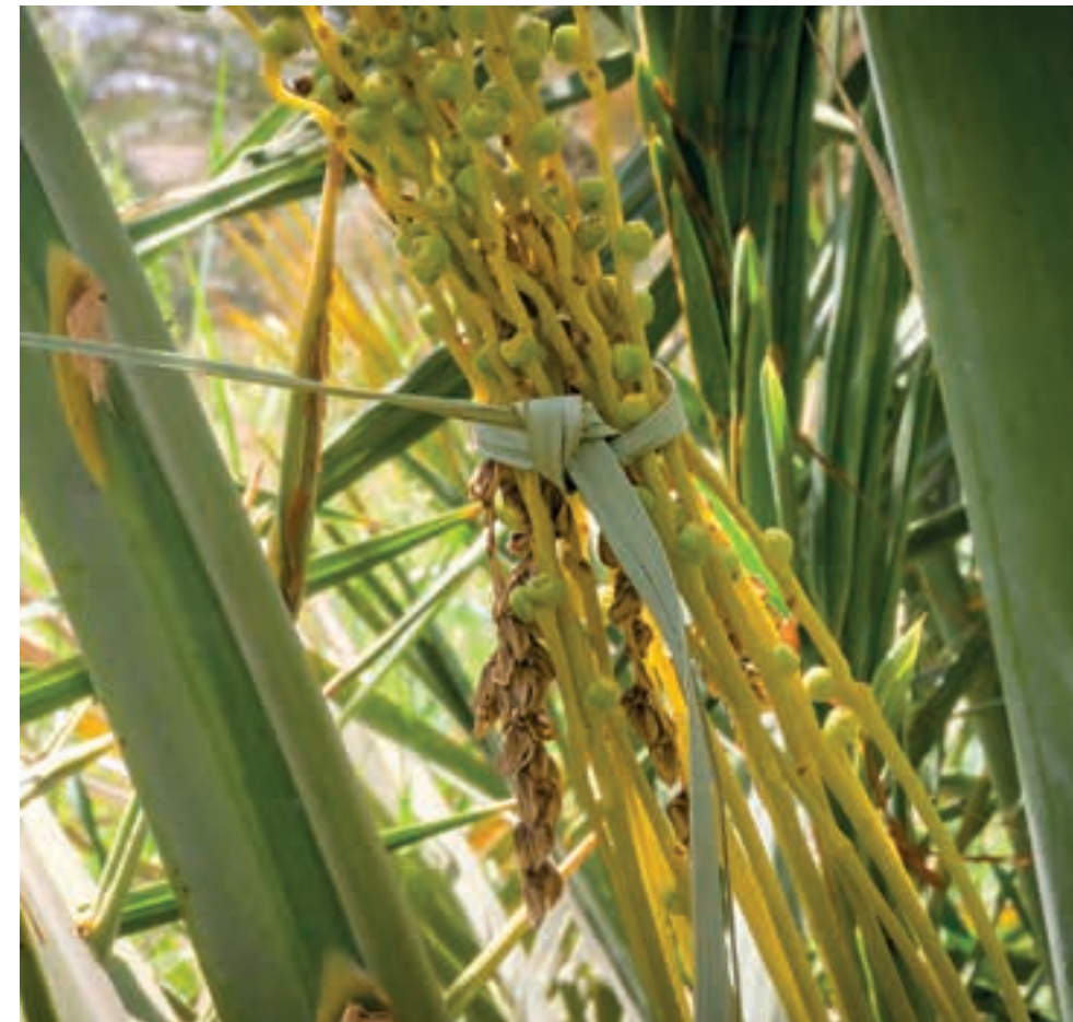
图 14， 雌性椰枣树授粉：雄性棕榈树 (棕色)的花束(穗)被攀附在雌花上， 很快便会形成枣簇；2020 年。

在绿洲的历史核心区域，从德丹北部至埃尔奥拉老城南部，据估计仍有 600 公顷的土地种植了约