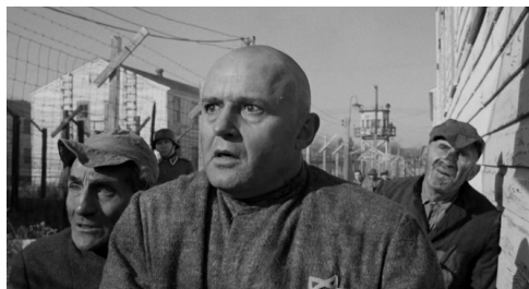
Fig. 17 : Le Prêteur sur gages (Lumet, 1964)