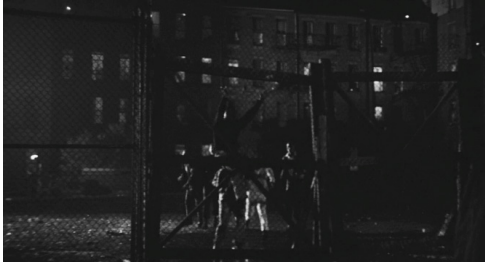
Fig. 8 : Le Prêteur sur gages (Lumet, 1964)