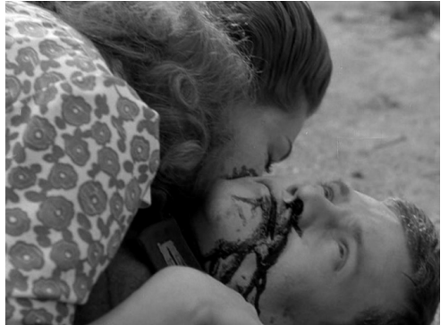
Fig. 5 : Hiroshima, mon amour (Resnais, 1959)