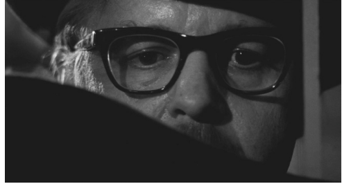
Fig. 7 : Le Prêteur sur gages (Lumet, 1964)

Dans les deux cas également, on remarque, dans l'environnement immédiat de Sol, la présence d'éléments déclencheurs du flash-back. Des sensations vécues au présent pointent, par analogie, vers des sensations équivalentes éprouvées par le passé, au moment du traumatisme originel, provoquant sa réactivation. Dans la première scène, il s'agit d'abord d'une sensation auditive : ce sont des aboiements hors champ qui font surgir le premier flash. C'est ensuite une sensation visuelle qui prend le relais et enfonce le clou : un garçon, agressé par une bande de jeunes, tente de fuir un playground en s'agrippant au grillage, ce qui fait immédiatement écho, dans l'esprit de Sol, à une scène vécue dans le camp nazi, lorsqu'un co-détenu – un bon ami de Sol – avait désespérément tenté de s'évader en s'accrochant aux fils barbelés qui encerclaient le camp. Le raccord par analogie se trouve renforcé par la logique des mouvements optiques : le brusque zoom arrière sur le prisonnier répond au zoom avant effectué dans le plan qui précède, sur le jeune homme attaqué par le gang. La relation entre présent et passé, basée sur une correspondance, est ici plus radicale que dans Hiroshima, mon amour , puisque nous n'avons, entre les deux plans distincts des hommes agrippés aux grillages, aucun plan de réaction sur le visage de Sol.