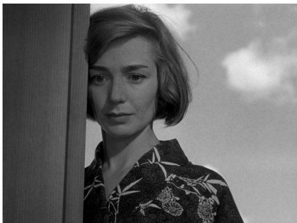
Fig. 3 : Hiroshima, mon amour (Resnais, 1959)

Toutefois, si le flash est si imprévisible, c'est parce que tous les signaux traditionnellement employés pour préparer le spectateur à un bond dans le temps ont été éliminés. En effet, les marqueurs de transition utilisés au seuil des flash-backs, tels que le fondu enchaîné ou le floutage de l'image, sont ici remplacés par un simple cut . Or, sur le plan formel, la coupe franche est bien plus tranchante, bien plus agressive que le fondu ; elle renforce l'effet de collision entre les plans successifs. Alain Resnais et son monteur Henri Colpi ont d'ailleurs parfois nommé « raccords léopards » ces sauts dans le temps qui s'effectuent instantanément, à la faveur d'un cut , les comparant par là aux bonds de ce félin. La sensation de choc que nous pouvons ressentir en tant que spectateurs est donc liée, ici et plus encore dans les scènes du Prêleur sur gages que j'étudierai bientôt, au jaillissement intempestif des flashes mnésiques, qui nous sautent littéralement au visage comme ils sautent à celui des personnages traumatisés 12 . À l'inverse, l'usage de figures de transition,