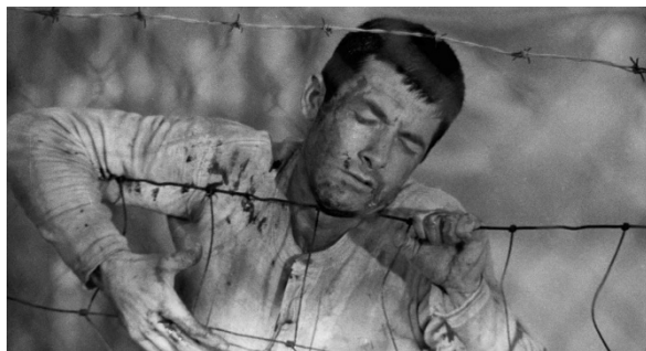
Fig. 18 : Le Prêteur sur gages (Lumet, 1964)

Ces six flashes successifs, on ne peut pas encore les relier les uns aux autres. Pour cela, il faut attendre un flash-back plus développé que les autres, qui arrive quelques instants plus tard et prend définitivement le pas sur la réalité présente en s'y substituant, tant sur le plan visuel que sonore. Il est à noter que ce flash-back, dans lequel culmine la scène, comporte en son sein de nombreux plans successifs, ce qui empêche de parler de « flash » à son