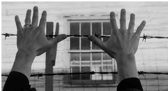
Fig. 14 : Le Prêteur sur gages (Lumet, 1964)

Dans la deuxième scène, et même si la jeune femme peut, en raison de son visage émacié et de son teint pâle, évoquer le physique d'une déportée – ou du moins l'image stéréotypée que nous pouvons en avoir –, ce n'est qu'au moment où Sol tourne son regard vers sa main, et donc vers sa bague, que le souvenir traumatique lui saute littéralement au visage.