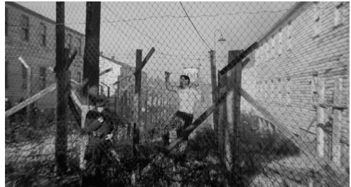
Fig. 11 : Le Prêteur sur gages (Lumet, 1964)