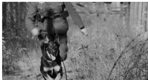
Fig. 16 : Le Prêteur sur gages (Lumet, 1964)

La première scène, celle des grillages, emploie cette même stratégie, mais Lumet en ajoute une seconde : après quatre plans très brefs d'un berger allemand qui court aux côtés d'un garde, il fait survenir d'autres flashes qui apportent des éléments nouveaux, sans liens apparents – au premier abord – avec les plans du chien. Ainsi, un flash donne à voir un détenu que l'on devine être Sol ; et un dernier flash montre le déporté qui s'accroche à la clôture.