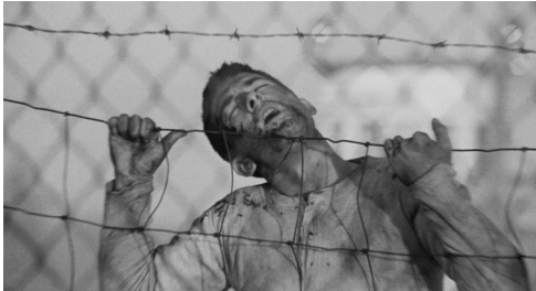
Fig. 10 : Le Prêteur sur gages (Lumet, 1964)