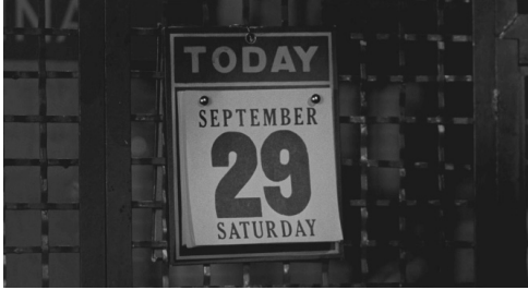
Fig. 6 : Le Prêteur sur gages (Lumet, 1964)

date sur l'éphéméride, au moment où il tire la grille de son magasin, cela entraîne chez lui un changement d'expression assez net, qu'accompagne une inflexion de la musique, qui prend soudain des tonalités discordantes.