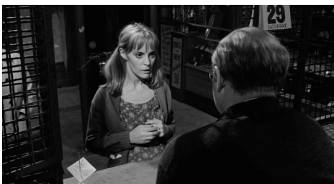
Fig. 12 : Le Prêteur sur gages (Lumet, 1964)