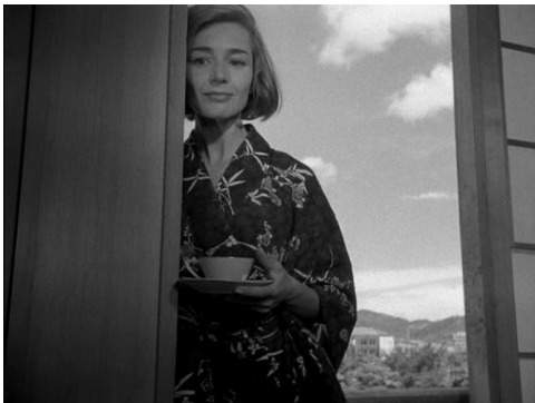
Fig. 1 : Hiroshima, mon amour (Resnais, 1959)

Dans Hiroshima mon amour , une scène est particulièrement frappante sur cette question. Le souvenir y surgit totalement par surprise : il fait effraction, hors de tout contrôle par la femme incarnée par Emmanuelle Riva, au moment où, depuis le balcon d'un hôtel, elle observe, dans son sommeil, son amant japonais (Eiji Okada).