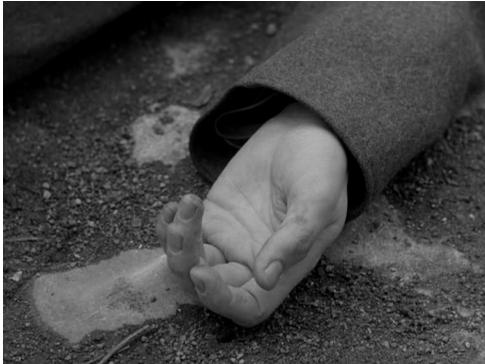
Fig. 4 : Hiroshima, mon amour (Resnais, 1959)

Une autre caractéristique décisive du flash-back d' Hiroshima mon amour est sa brièveté. Il se compose en effet d'un seul et unique plan de moins de trois secondes, qui débute sur une main et se poursuit par un panoramique rapide, presque un filé, qui remonte le long du corps d'un homme couché à terre, avant de s'achever sur son visage ensanglanté. Une jeune femme l'embrasse passionnément.