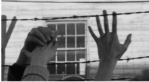
Fig. 15 : Le Prêleur sur gages (Lumet, 1964)

Sidney Lumet lui-même, dans Faire un film , explique son raisonnement :