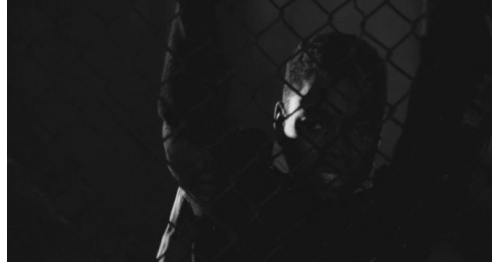
Fig. 9 : Le Prêteur sur gages (Lumet, 1964)