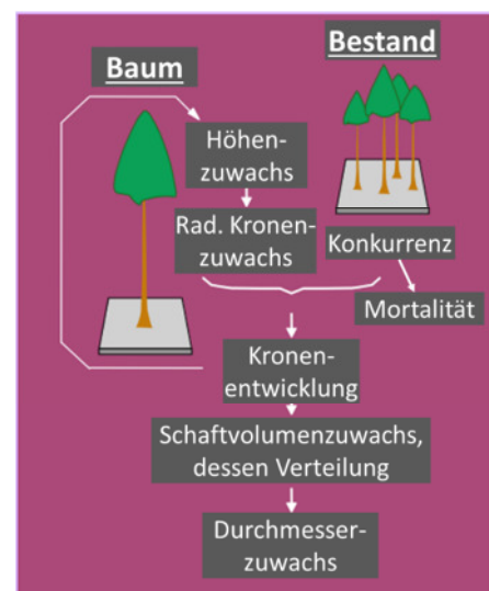
Abbildung 1: Wesentliche Wachstumsprozesse und -zusammenhänge, die durch das Wuchsmodell SimCoP (OTTORINI 1991, 1995; WERNSDÖRFER et al. 2016) beschrieben werden.

Mortalität tritt ein bei zu hohen Bestandesdichten („Self-thinning“; NINGRE ET AL. 2016) oder wenn ein Baum mehrere Jahre von den Nachbarbäumen überschirmt worden ist. Das Wuchsmodell wurde in die Plattform Capsis (DUFOUR-KOWALSKI ET AL. 2012) für waldbachstumskundliche Simulationen implementiert. Dabei können waldbauliche Eingriffe zum einen durch die Entnahme von Einzelbäumen anhand der Kronenkarte erfolgen. Zum anderen kann eine Abfolge mehrerer Eingriffe anhand eines Algorithmus simuliert werden, der Entnahmewahrscheinlichkeiten nach Durchmesserklassen und die räumliche Verteilung der zu entnehmenden Bäume berücksichtigt.