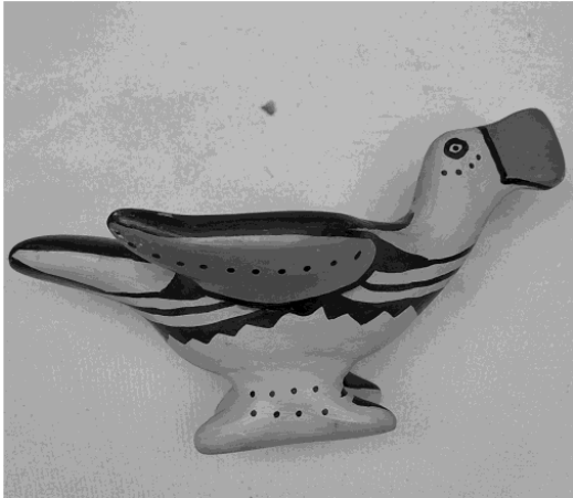
Ceramic bird – Northeastern Brazil (Ceará/Pernambuco), earth-tone colors and naïve forms, in a style closely related to Northeastern folk art.