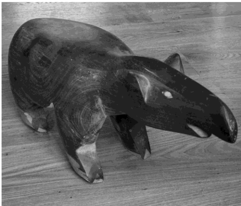
Wooden sculpture of a giant anteater – Brazilian Amazon (Pará/Amazonas), emblematic animal