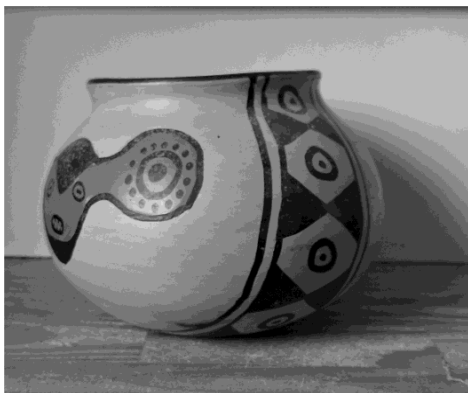
Ceramic vase with geometric patterns, Marajoara culture (Marajó Island, Ama- zon estuary – Pará, c. 400–1400 CE)