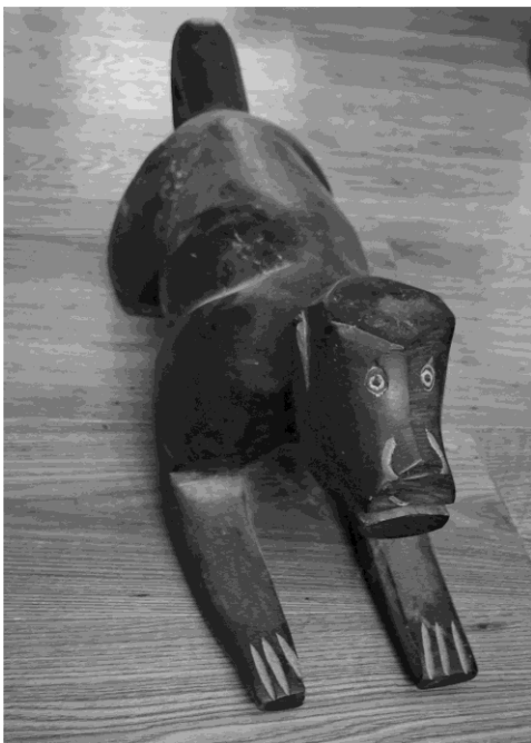
Sculpture en bois – singe -Art populaire amazonien (Brésil nord)