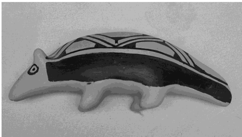
Small ceramic figure of an animal (armadillo or stylized anteater) – Northern Amazon, local fauna