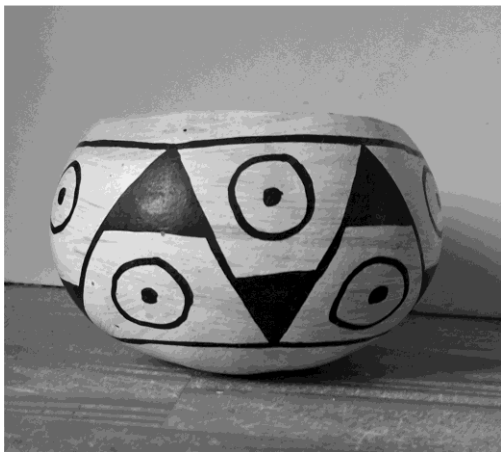
Bol à motifs triangulaires et cercles Amazonie centrale ; traditions Tapajós/Santarém (Pará)