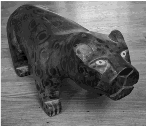
Spotted sculpture – jaguar – Amazon/Mato Grosso – Sacred animal in many Indigenous cosmologies (Kayapó, Xavante, etc.)