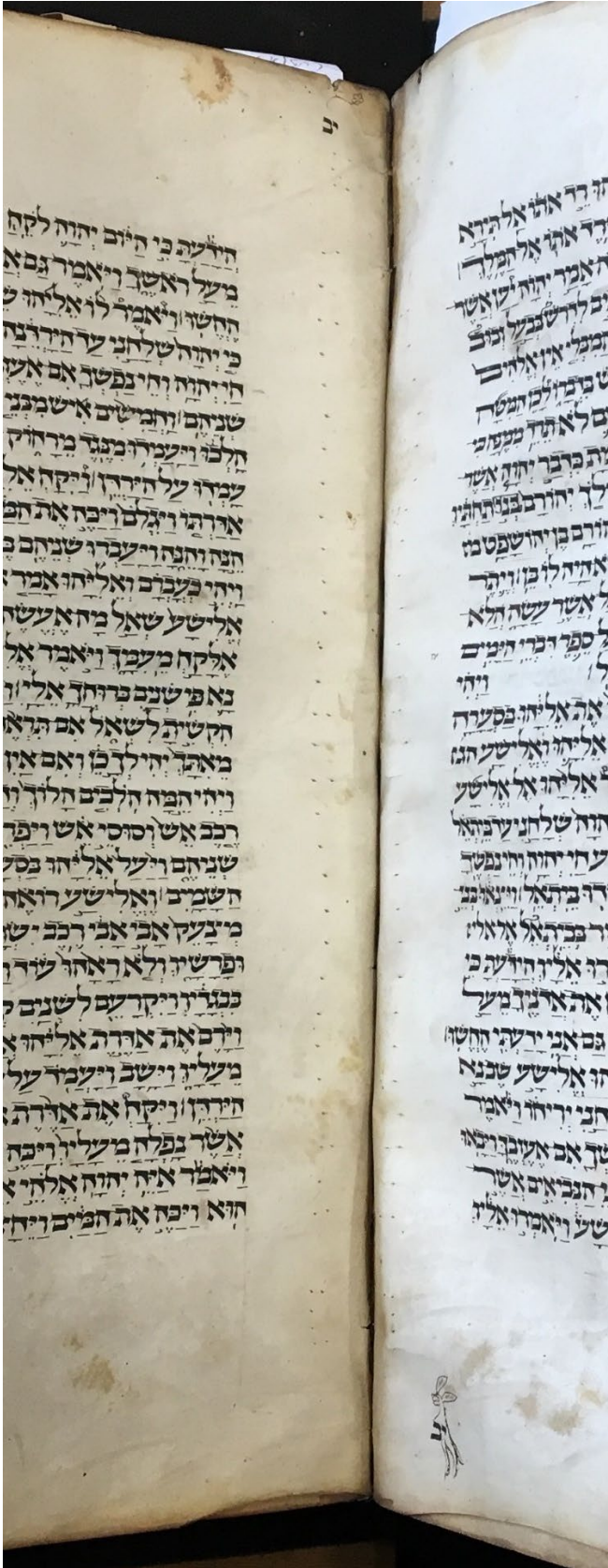
Ms. Hamburg, SÜB, Cod. hebr. 3, fin du cahier 12 (c) E. Attia, Projet MBH 2024, lièvre et fleur

accompagné d'un dessin décoratif. Ce chiffre 12 est lui-même répété en haut du premier folio du cahier suivant.