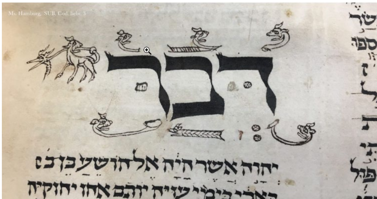
Ms. Hamburg, SÜB, Cod. hebr. 3, début du livre de Osée

Le manuscrit hébreu 3 conservé à la Bibliothèque universitaire de Hambourg (Allemagne) est une bible hébraïque médiévale de grand format (taille H+ L supérieure à 700 mm) contenant les Prophètes, vocalisés et accentués mais dépourvu de massore marginale, à l'exception de quelques endroits où elle semble avoir été prévue. Ce manuscrit est estimé daté sans doute de la deuxième moitié du XIII e siècle. Il provient peut-être de France, son style gothique étant assez prononcé.