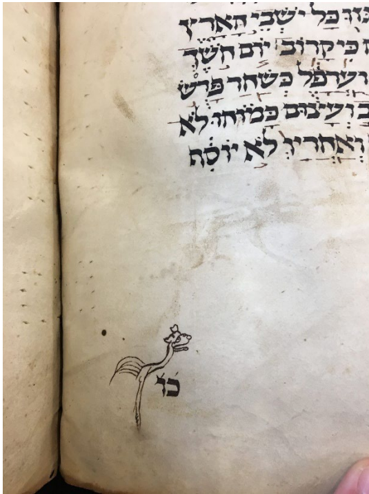
Ms. Hamburg, SÜB, Cod. hebr. 3, fin du cahier 26 (c) E. Attia, Projet MBH, 2024, Coq monstre

Dans les exemples de réclames retenus ci-dessous, on observe alors une variété de créatures, réelles (poisson-monstre, lapins, oiseaux de type héron) ou fictives (monstres et gargouilles).