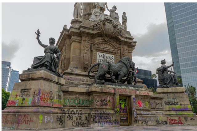
Figure 3. Partie ornementale basse du monument de l'Indépendance, après le 16 août 2019