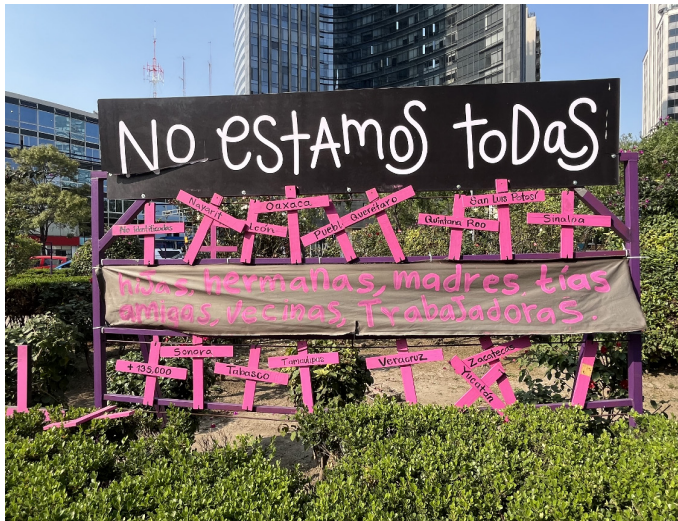
Figure 9. «Nous ne sommes pas toutes là»