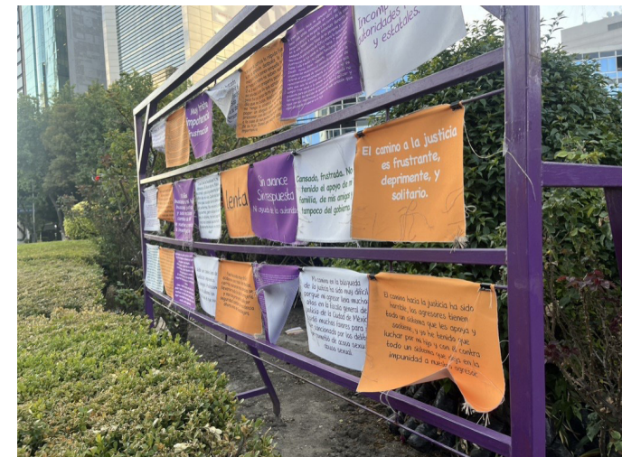
Figure 10. «Etendoir de dénonciations» [ tendedero de denuncias ] inspiré de l'œuvre de Mónica Mayer

arrivées», avait-elle prononcé 62 . Toutes... à l'exception des dizaines de milliers de femmes assassinées, victimes de disparition, répondit le FAMIL, soulignant le déphasage total entre la communication présidentielle et la vie des femmes vulnérabilisées par la violence de masse.