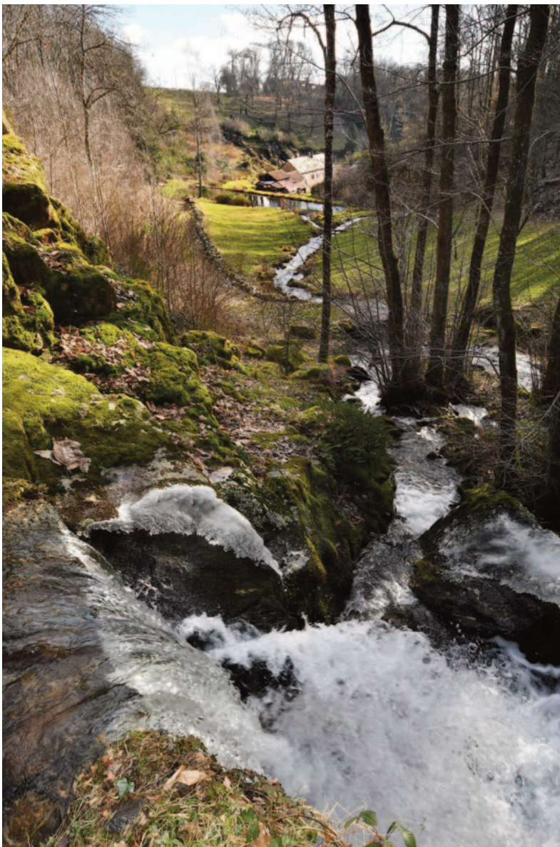
Le Mechet et en arrière plan le moulin de Montcharmont.