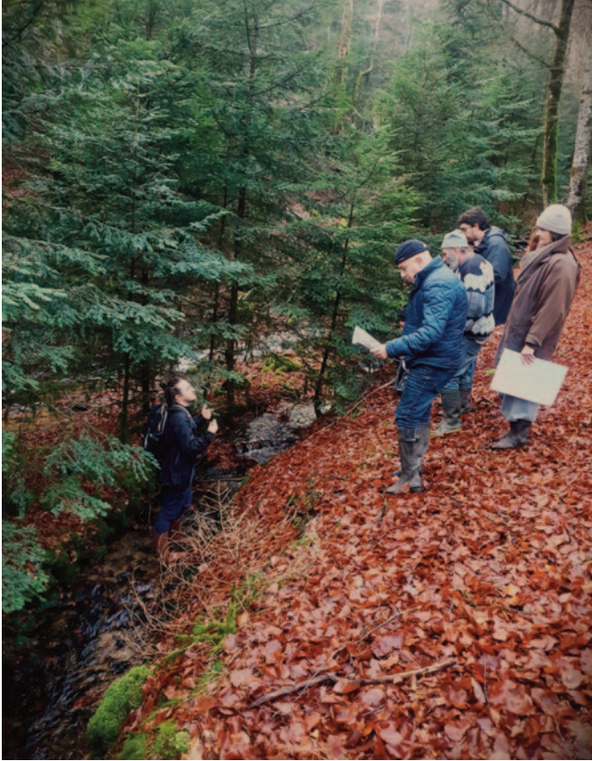
Fig.1,C : Portion toujours en eau d'une rigole en pierre à l'état d'abandon dès 1810 (Bois l'Abbesse, Saint-Prix).

mètres. Dans ce dernier cas, ces aménagements traversaient plusieurs propriétés et étaient gérés collectivement entre les propriétaires ou locataires riverains. Il y avait des obligations d'entretiens et des règles qui organisent les droits d'eau avec des temps d'arrosage définis pour chaque exploitant. La pratique est documentée dans le Morvan dès la seconde moitié du XIV e siècle : elle est alors déjà bien implantée sur le territoire. Si d'anciens tracés ont pu être abandonnés au profit de nouveaux, certaines rigoles présentent des talus de curage et d'entretien proéminents, voire parfois des parements en pierres de très bonne facture, preuve que ces éléments étaient conçus pour durer (fig.1, C). Autrement dit, il est possible que certains chenaux soient plus anciens encore que la plupart des maisons de hameaux, mais il manque à ce sujet une approche archéologique de cette petite hydraulique agricole sur notre territoire. Avec la révolution agricole du XIX e siècle et l'introduction des prairies artificielles et fourragères dans les rotations des cultures, la pratique commence à être abandonnée. Ce déclin s'intensifie après-guerre avec la mécanisation, l'élargissement des exploitations et la déprise des fonds difficiles à entretenir. Enfin, paradoxalement, la spécialisation du Morvan dans l'élevage allaitant a – lui aussi – rendu caduque cet usage en convertissant les cultures en pâtures.