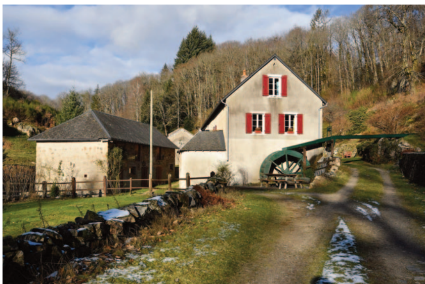
Moulin de Montcharmont sur le Méchet (Saint-Prix).

En amont, à la Boutière, se trouve l'ancien moulin banal de la seigneurie éponyme dont le manoir se situe juste