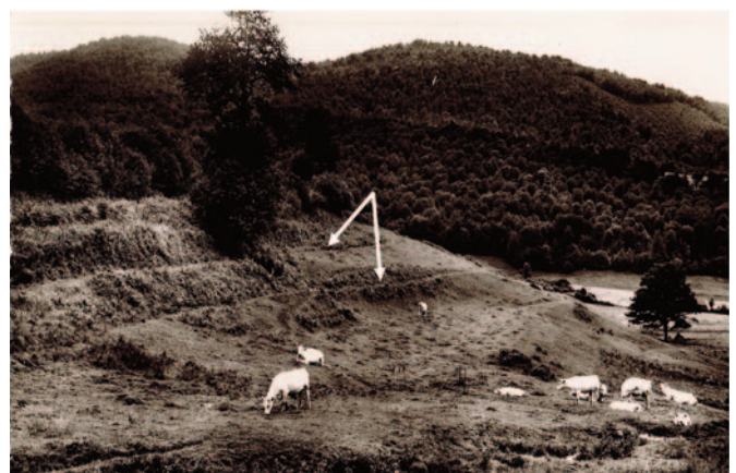
Fig.1,B : Ancien pré converti en pâture sur les abords du Beuvray dans les années 1950. Les flèches désignent deux rigoles.

Si certaines rigoles étaient fonctionnelles à l'échelle des parcelles, d'autres faisaient plusieurs centaines de