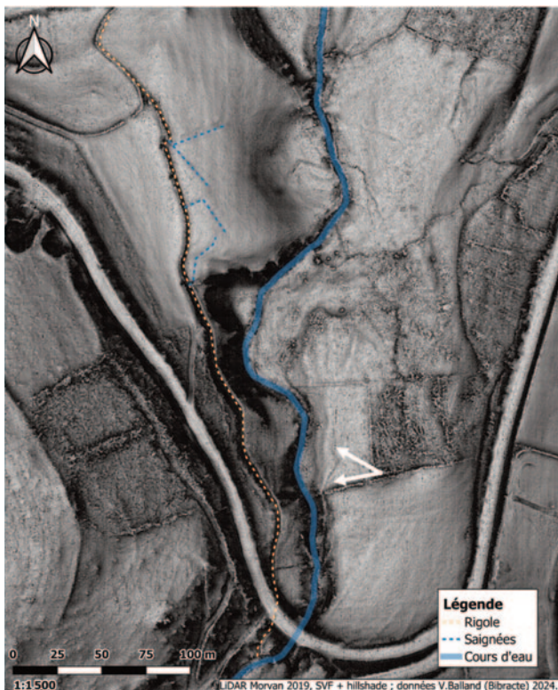
Fig.3,D : Carte LiDAR de la rigole. La flèche désigne une autre rigole sur l'autre rive.