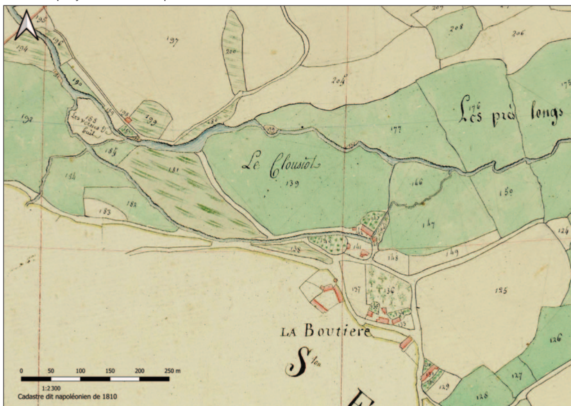
Fig.4,B : Extrait du cadastre dit napoléonien de Saint-Léger-sous-Beuvray, Section de la Boutière, 1810. On aperçoit le bief et ses prises d'eau sur le Méchet et le ruisseau de la Côme Chaudron.