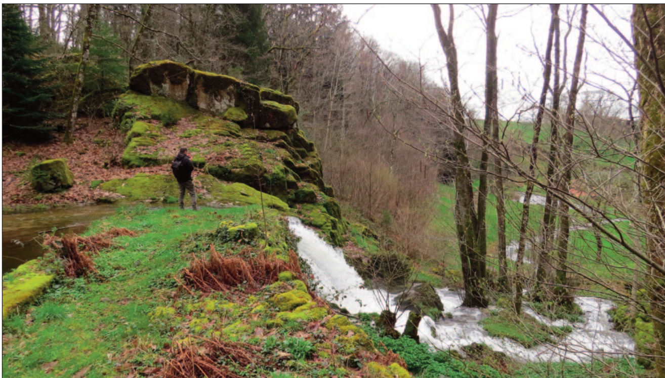
Le Méchet en amont du moulin de Montcharmont.