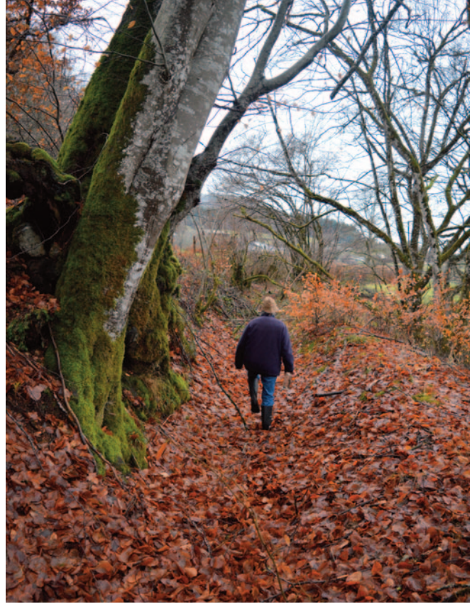
Fig.3,B : Marche dans le lit asséché de la rigole au milieu d'un bois.

Aujourd'hui seuls de rares exploitants poursuivent avec intermittence cette pratique mais sur des parcelles enclavées, difficiles à entretenir, reconnaissant les qualités fourragères apportées par la technique. Et même s'ils n'utilisent plus l'irrigation gravi-