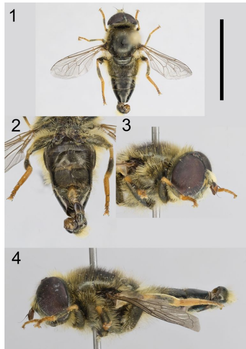
Figures 1 à 4. Mâle de Merodon auriolus capturé à Rognac (Bouches-du-Rhône) le 17-IV-2022 : 1) Habitus, vue dorsale ; échelle : 1 cm. 2) Face ventrale de l'abdomen avec les pattes postérieures. 3) Tête. 4) Habitus, vue latérale.