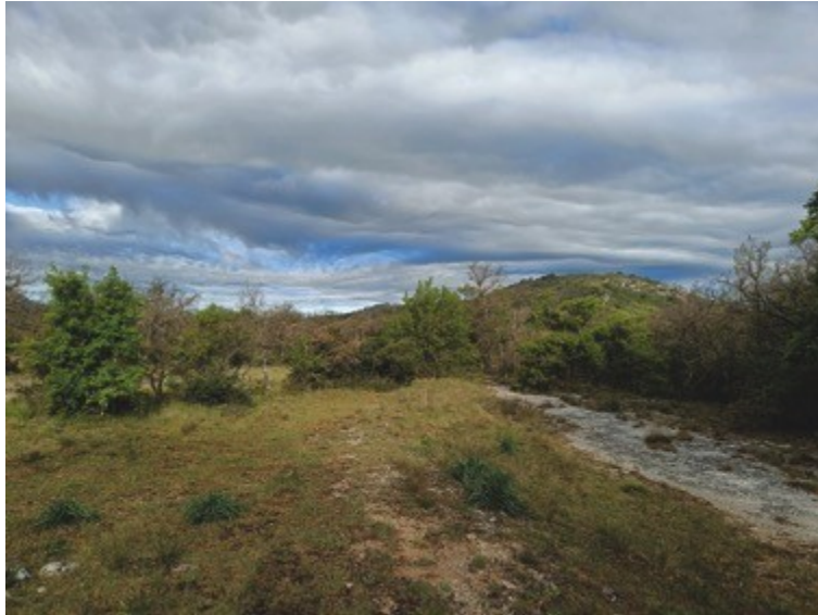
Figure 6. Site de capture de Merodon auriolus à Plan-d'Aups-Sainte-Baume le 7 mai 2024.