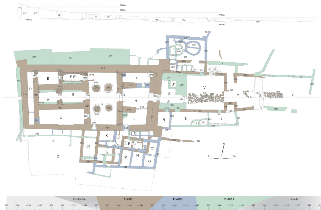
Fig. 1. Le temple de 'Ayn Manawir (synthèse archéologique) ©IFAo, A. Gigante/Achemenet.

du temple d'Amon 31 , et à Tuna el-Gebel, dans la « maison des prêtres » d'époque ptolémaïque construite dans les parages de l'Ibiotapheion 32 . L'exemple de 'Ayn Manawir tend à montrer que les s.wt n ḥw.t-ntr étaient pensées comme des maisons étroitement liées au temple. Ce n'est que faute de place ou de moyens qu'elles prirent la forme de pièces placées dans des bâtiments adjacents ou accolés au sanctuaire 33 .