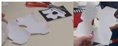
Figure 6 – Deuxième napperon découpé par Ollie (à gauche) et son napperon final (à droite)