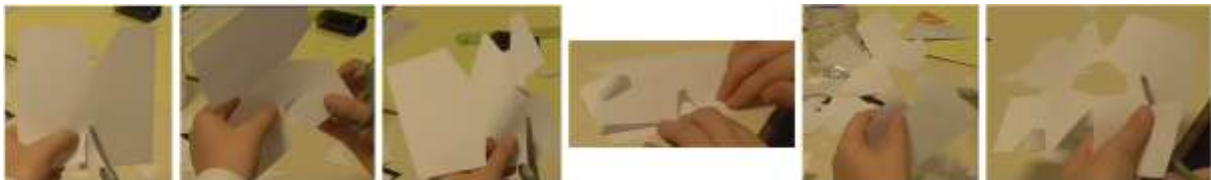
Figure 5 – Succession des découpages d'Alfred