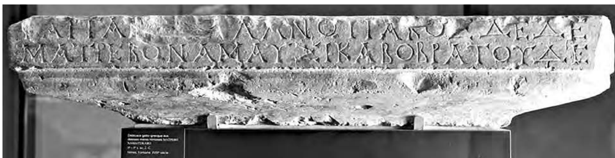
Fig. 2. RIIG GAR-10-01 = RIG I, G-203. Dédicace aux Mères Nîmoises (vue générale) (crédit F. Comte, © RIIG (ANR 19-CE27-0003), avec l'aimable autorisation du musée de la Romanité (Nîmes). URI : https://www.nakala.fr/11280/75cd6224 .

Le portique de la Villa Roma a été rapidement remplacé à l'époque pré-augustéenne par une autre structure qui deviendra par la suite l' Augusteum . Dans le soubassement de cette dernière, on a trouvé une inscription gallo-grecque débitée en deux gros blocs 32 . Ils mentionnent en langue gauloise la dédicace d'un édifice, non identifié à ce jour, mais sans doute nommé *μαδερα (RIIG GAR-10-12 = Compléments gallo-grecs 1994, G-528), qui a été offert dans une démarche à caractère évergétique par un certain Nertomaros , un individu probablement issu d'Anduze 33 . L'inscription votive pourrait comporter, selon Lejeune, le uerbum dandi gaulois, ειωραί à la l. 4, utilisé pour une offrande d'un autre ordre que pour les statues, même si l'inscription reste difficilement déchiffirable à cet endroit à nos yeux. Ce type de dédicace ne mentionne pas toujours explicitement le dieu, mais en revanche toujours l'objet consacré 34 . On aimerait penser qu'il s'agit du portique lui-même, comme l'a suggéré récemment Emmanuel Dupraz 35 . Alors que la façade du bâtiment est remarquablement travaillée, l'intérieur de l'édifice est totalement vide. Aucun élément ne permet de lui attribuer une fonction précise. Ce qui retient l'attention ici, c'est que le bloc qui porte l'inscription en langue gauloise a été considéré, dans le premier tiers du I er siècle av. J.-C., comme suffisamment inutile ou ayant perdu sa