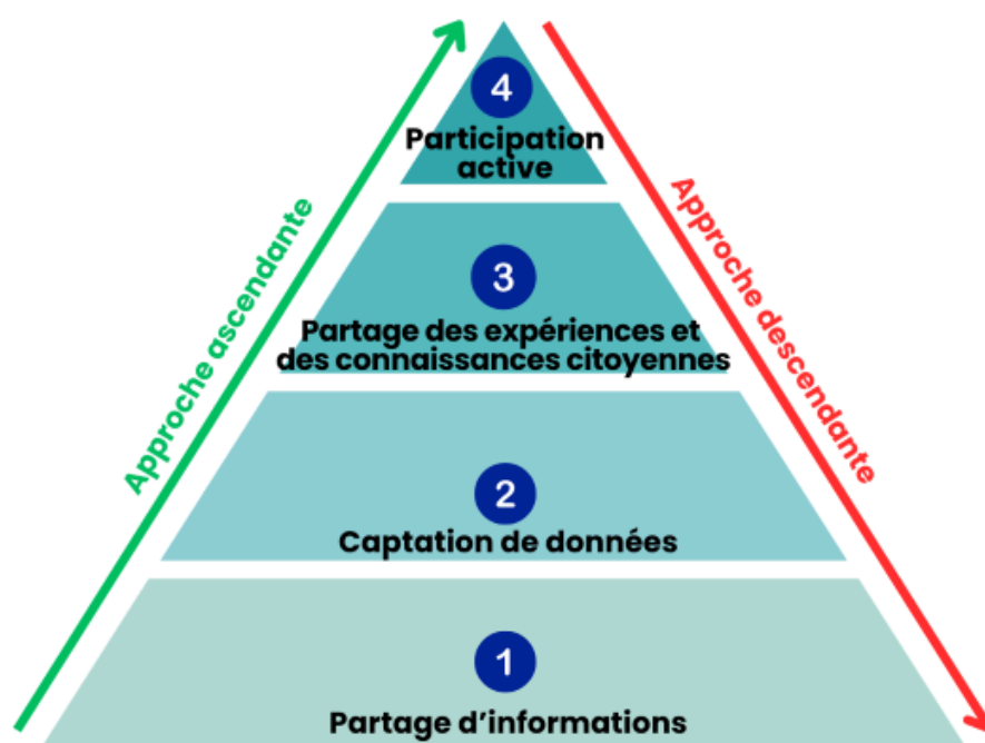
Figure 1. Pyramide des niveaux d'implication des citoyens dans les projets de villes intelligentes et ascendance