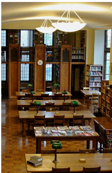
Figure 3. Salle de lecture Birks (annexe de la Bibliothèque des sciences humaines et sociales de la bibliothèque de l'Université McGill, en 2009)