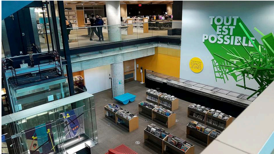
Figure 4. Bibliothèque nationale, l'espace jeunesse