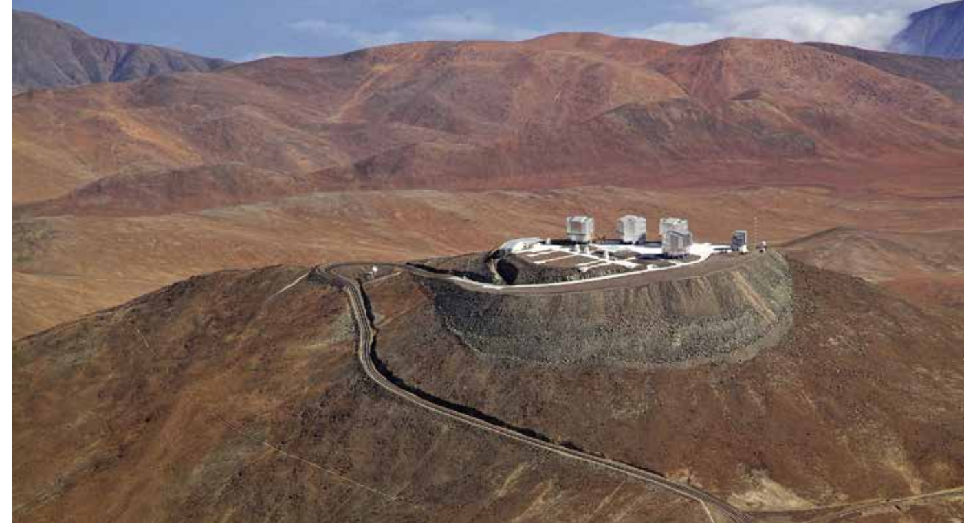
Le Very Large Telescope est situé dans le désert d'Atacama, l'un des endroits les plus arides au monde.

La lumière visible, que nos yeux peuvent détecter, ne représente qu'une infime partie du message lumineux émis par les objets célestes. Le VLT est équipé d'instruments qui lui permettent de capturer la lumière sur une palette spectrale plus large que celle du visible. Cette performance est à l'origine de découvertes majeures, comme la détection de molécules dans une galaxie située à près de 11 milliards d'années-lumière. En analysant la lumière émise par ces molécules, les astronomes ont pu déterminer la température de l'Univers au moment de son émission, car, du fait de l'expansion de l'Univers, observer loin, c'est remonter dans le passé. L'observatoire a également joué un rôle dans la première détection par des télescopes optiques d'une source d'ondes gravitationnelles. Cet événement cataclysmique, qui s'est produit lors de la fusion d'étoiles à neutrons, a provoqué une émission de lumière que la flotte de télescopes de l'Observatoire européen austral a pu analyser sur différentes longueurs d'onde.