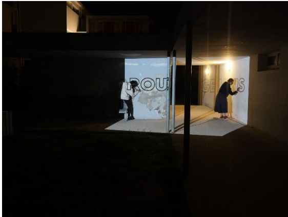
Fig.6, l'artiste et une élève tracent de nuit le contour des lettres qui vont constituer l'anamorphose ROUGE UNIS

Dans la dernière phase de la création collective, l'artiste vient au lycée à la nuit tombée pour tracer les contours des mots qui vont former les anamorphoses. Des élèves internes ainsi que la professeure-documentaliste s'associent ponctuellement à ce travail. Là encore, les lieux font l'objet d'une expérience renouvelée, puisque ces espaces ne sont pas accessibles de nuit, en temps ordinaire.