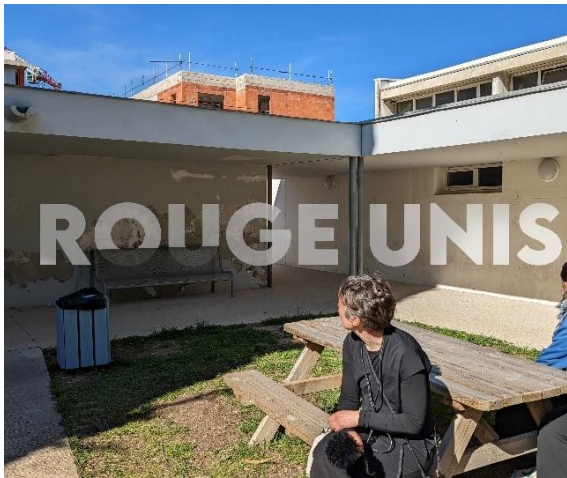
Fig.7 : L'anamorphose ROUGE UNIS que nous observons avant qu'elle ne soit recouverte

Mais ce partage « (...) est toujours une distribution polémique des manières d'être et des "occupations" dans un espace des possibles » (Ibidem). Il n'est pas un donné et doit être constamment défendu. Cependant, malgré les limites qui apparaissent à la fabrique du sensible dans cette recherche, nos travaux ont pu mettre en évidence la fabrique informationnelle de la recherche participative (Catellani et al., 2021). En effet, si les traces matérielles de ce partage du sensible ont disparu, la recherche permet de rendre compte qu'il a, malgré tout, bel et bien été vécu.