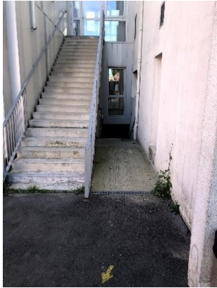
Fig. 4 entrée de la Bad Cave