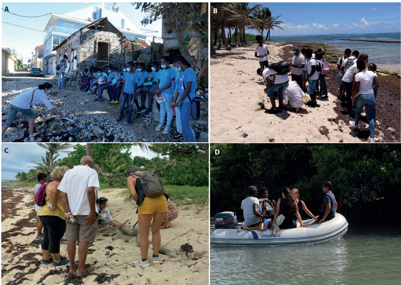
Fig. 3 – Animations de terrain en Guadeloupe dans le cadre du projet « ALOA » : a) élèves de CM1 de l'école Adélaïde-Amédée, sur le site de Petite Anse, Le Moule (cliché L. Quesnel, 25 janvier 2022) ; b) élèves du collège Guénette (Le Moule), sur le site de Morel, Le Moule (cliché E. López-Romero, 31 mai 2022) ; c) bénévoles de l'association Kap Natirel (réseau Tortues marines), sur le site de Morel, Le Moule (cliché E. López-Romero, 28 mai 2022) ; d) débarquement de l'équipe de prospection sur l'îlet Fortune, Goyave, dans le cadre de la campagne de prospection (cliché M. Ariza, 8 août 2022).

Grâce à ces soutiens actifs, des actions ciblées d'information et de communication ont pu être menées auprès des directions des écoles et des collèges, mais aussi auprès de différents médias, qui ont réalisé des reportages télé et un même un Facebook live qui a touché 2 000 spectateurs ! Si la communication vers les associations a été plus difficile à mettre en place dans l'archipel guadeloupéen, une collaboration inédite est née avec le réseau Tortues