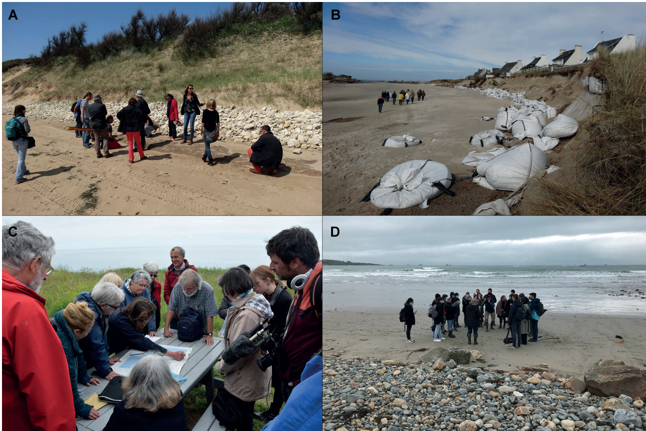
Fig. 2 – Professionnels, membres du public et étudiants lors de séances de formation et d’information sur le terrain dans le cadre du projet « ALeRT » : a) Longeville-sur Mer (Vendée, 2016 ; cliché M.-Y. Daire) ; b) Grève Blanche, avec des membres de l’association ARSSAT (Trégastel, Côtes-d’Armor, 2014 ; photographie de M.-Y. Daire) ; c) Trégunc (Finistère, 2019 ; cliché J.-P. Le Bihan, CRAF, Quimper) ; d) Plougasnou (Finistère, 2022 ; cliché M.-Y. Daire).

Fig. 2 – Professionals, members of the public, and students during training and information sessions in the field as part of the “ALeRT” project: a) Longeville-sur-Mer (Vendée, 2016; photo by M.-Y. Daire); b) Grève Blanche, with members of the ARSSAT association (Trégastel, Côtes-d’Armor, 2014; photo by M.-Y. Daire); c) Trégunc (Finistère, 2019; photo by J.-P. Le Bihan, CRAF, Quimper); d) Plougasnou (Finistère, 2022; photo by M.-Y. Daire).