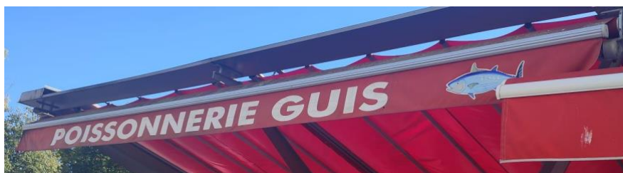
Fig.2 – Le vélum d'un marchand avec nom et indication de la marchandise vendue

Il a apporté des modifications à son stand, l'a équipé d'un velum pour avoir de l'ombre pour lui et sa marchandise lors des fortes chaleurs. Autrement dit, en plus d'éviter que la marchandise ne se gâte, le pare-soleil permanent offre à son propriétaire un confort notable. Certains marchands se servent aussi du velum pour promouvoir leur nom et faire savoir qu'ils occupent l'emplacement même quand ils ne sont pas là (fig.2).