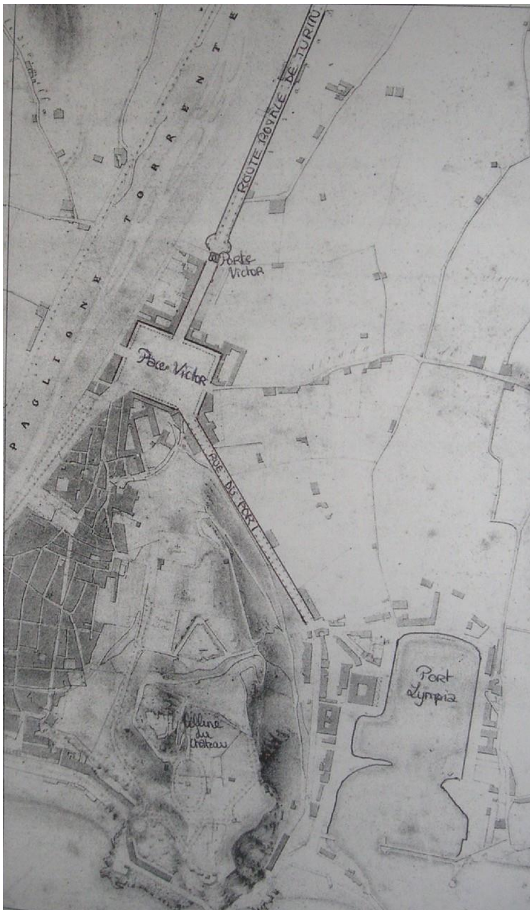
5/ Place Victor, élément d'organisation de l'espace urbain, Carte issue du Plan Régulateur de la ville de Nice de 1831, Archives Municipales de Nice- Fonds - 1Fi 1-1