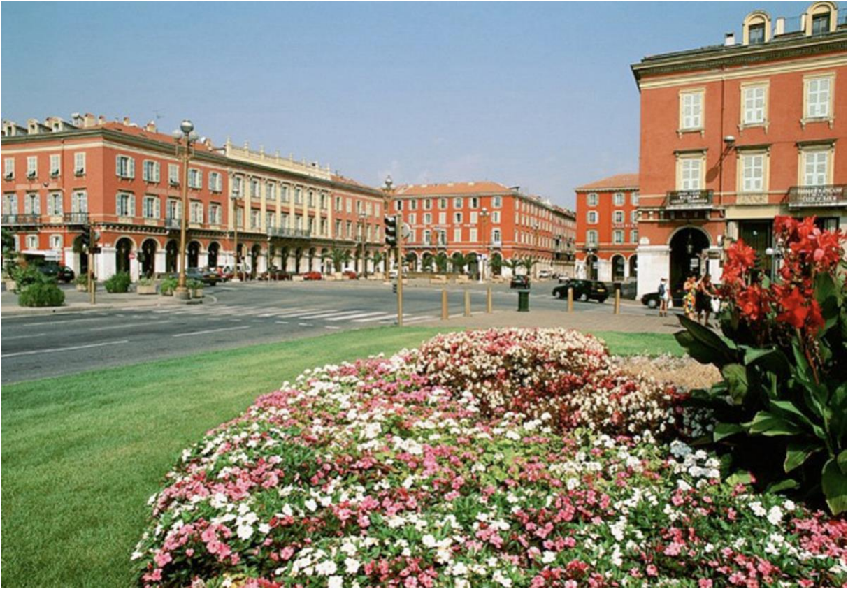
6/ Piazza Statuto, Turin