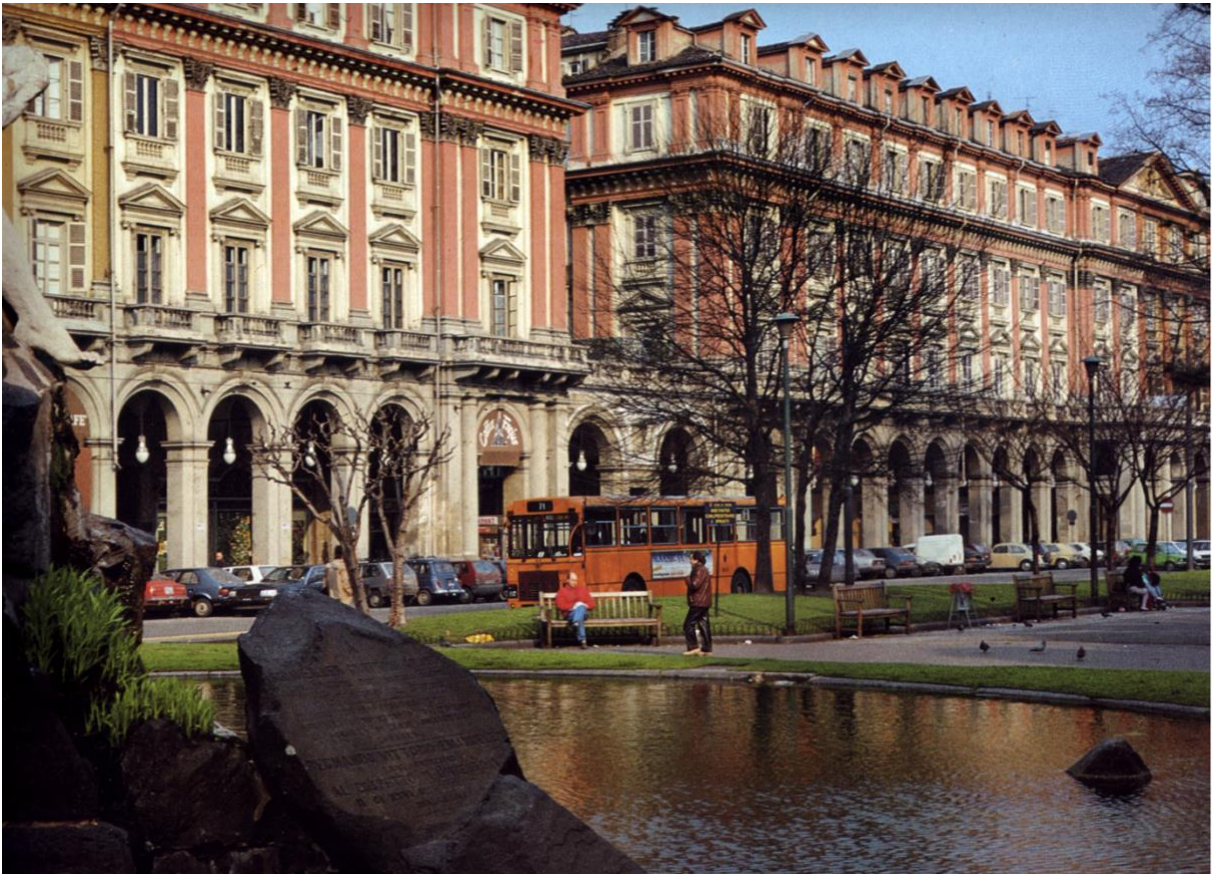
7/ Place Masséna, Nice