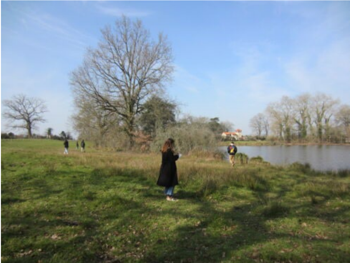
Au bord de l'étang du château de Maubreuil