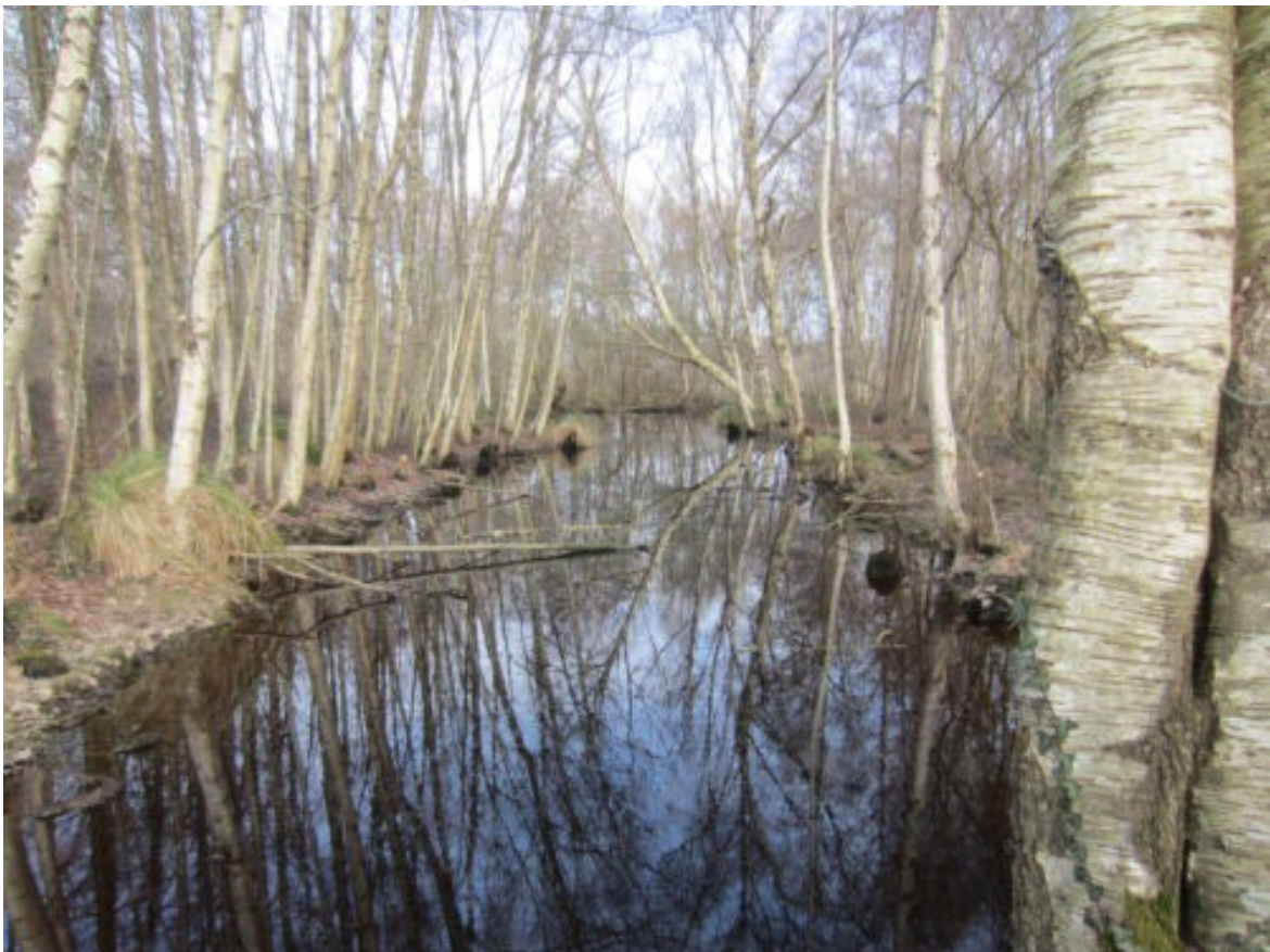
Respirer la tourbière de Logné, quel air mis en soi ? (photographie de l'autrice)

Les mots d'ordre livrés aux étudiant.es sur le quai de la gare de Sucé sur Erdre ce matin-là sont pomper , drainer , draquer et les présences des éléments, airs , eaux , sols . J'insiste sur l'attitude, sur la nécessité anthropocénique de se rendre davantage sensible ; pour cela nous allons marcher longtemps, sans vraiment prendre de photographies ou de notes. La marche est un dispositif d'attention, de captation, et nous allons travailler à partir d'indices, de troubles (Harraway) saisis grâce à cette qualité, précisément, de l'attention en mouvement, des pieds, du corps, sans trop penser, sans trop chercher. La première phase du studio se nomme décentrement , un décentrement par le vivant (Zong-Mengual, Morizot, entre autres...) que je vais essayer d'incarner sur les deux jours.