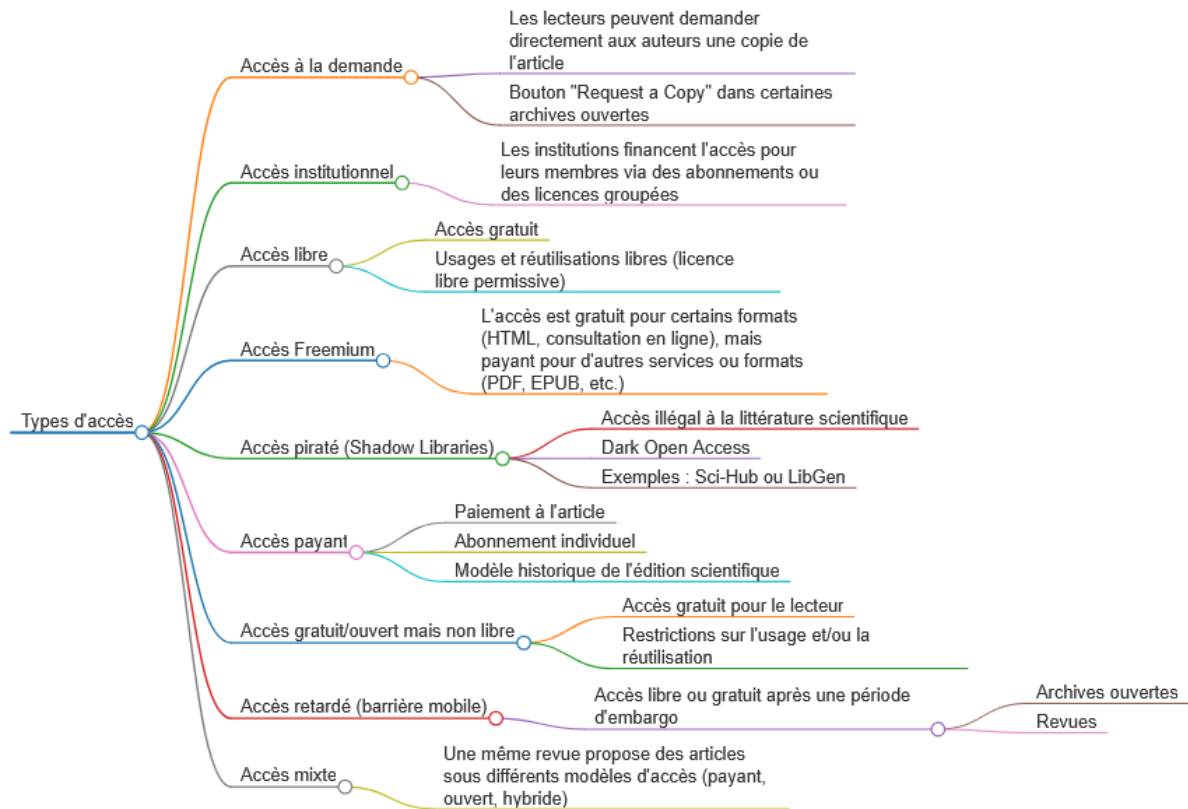
Figure 2 : Typologie des formes de Libre accès à la littérature scientifique.

La figure 2 illustre la complexité que sous-tend aujourd'hui l'idée d' Open Access . Elle montre que le découplage, ou dissociation, entre une norme d'ouverture et des conditions réelles appliquées, peut se produire de différentes manières : embargo, piratage, standardisation commerciale... Il convient de souligner trois points en la matière.