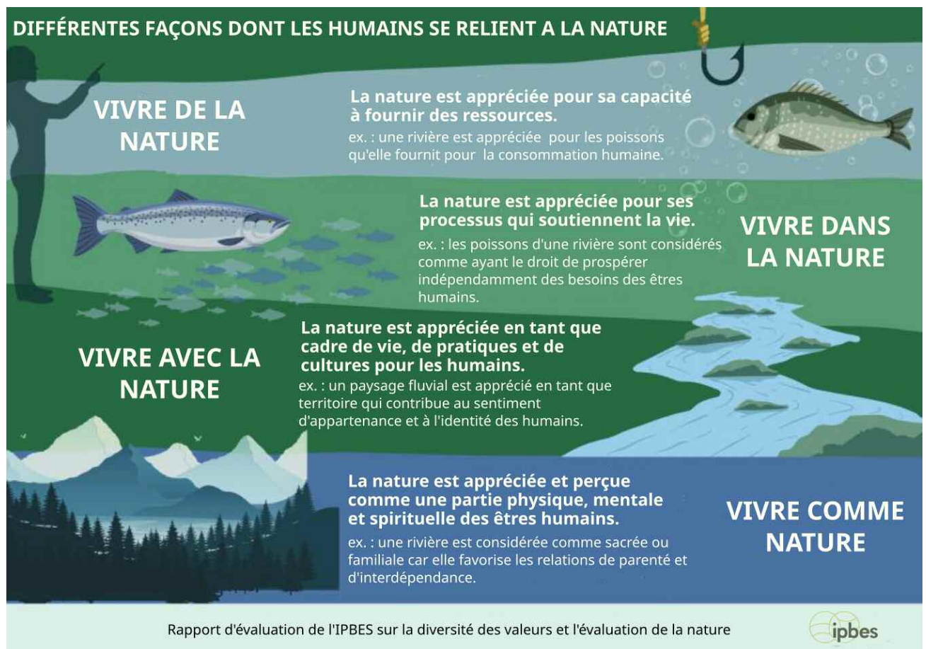
Figure 1. Les différentes façons dont les humains se relient à la nature selon Anderson et al. (2022)

La modernité s'est caractérisée par la réduction de ces quatre modalités à une seule : « vivre de » la nature en tant que ressource, conçue comme un capital naturel dépourvu de valeur intrinsèque et destiné à être transformé en biens économiques et en services écosystémiques (au seul bénéfice des humains) (Costanza et al. 1997). Par conséquent, à la campagne comme en ville, « vivre avec » doit être réduit au minimum. « vivre dans » n'a été préservé que dans un sens récréatif, au mieux. Quant à « vivre comme », cela est vigoureusement rejeté au nom d'une étrangeté fondamentale de l'humanité par rapport à la nature.