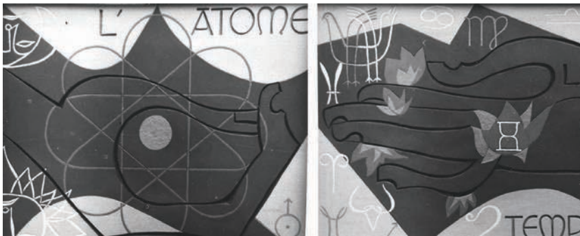
Fig. 7 – Bureaux et vestiaires. À gauche, L'Atome , ciment gravé et peint (50 m 2 ), 1960 ; à droite, Le Temps , ciment gravé et peint (50 m 2 ), 1960.