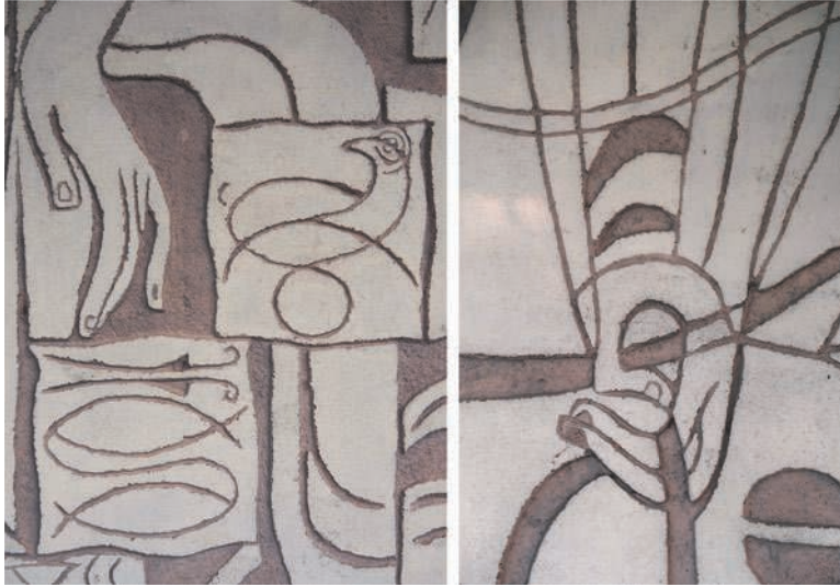
Fig. 3 – Décoration du cimetière de Donges (détail), béton gravé et peint.

À gauche : Gwenaële Rot, 2022. À droite : François Vatin, 2024.