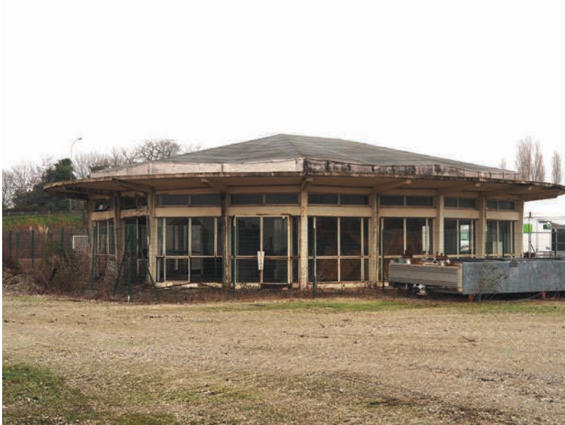
Fig. 5 – Salle de contrôle du TGC0, état actuel.