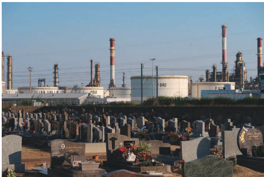
Fig. 1 – Donges, son cimetière, sa raffinerie.