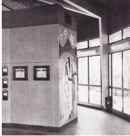
Fig. 11 – Salle de contrôle du TGCO : fresque de Robert Lesbounit et tableaux de contrôle.

L'Architecture française , n° 235-236, mars-avril 1962, p. 24.