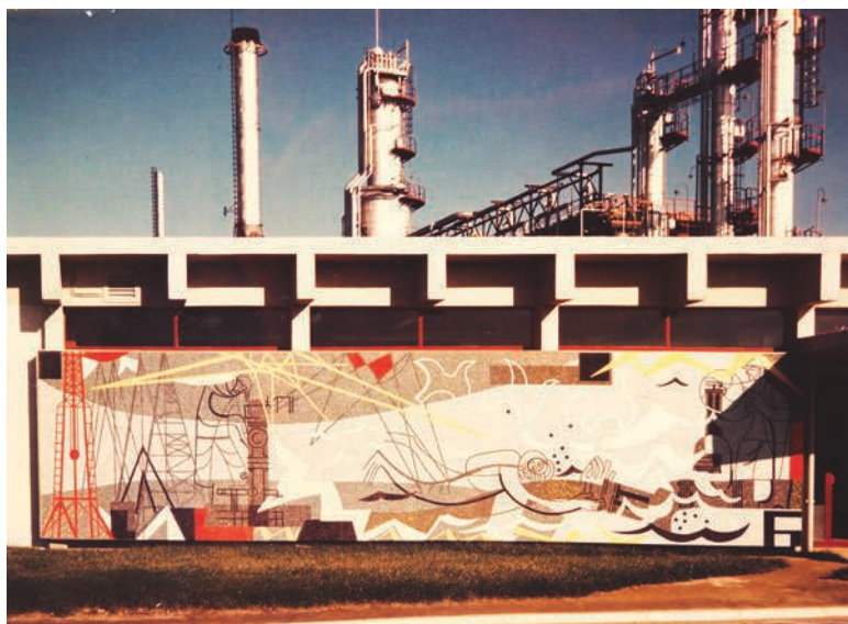
Fig. 12 – Raffinerie Antar de Vern-sur-Seiche, Histoire du pétrole (panneau 1), mosaïque, 1965.