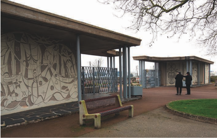
Fig. 2 – Entrée du cimetière de Donges, vue d'ensemble.