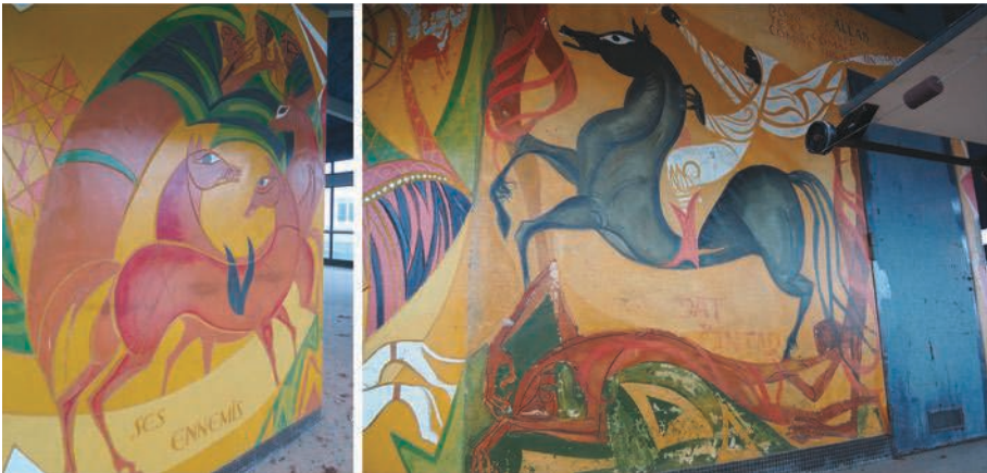
Fig. 9 – Salle de contrôle du TGCO de Donges. À gauche, Les Ennemis d'Antar , ciment gravé et peint ; à droite, Le Combat d'Antar , ciment peint.