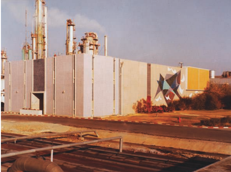
Fig. 14 – Raffinerie de Fos-sur-Mer, décoration à la thématique inconnue, mosaïque (75 m 2 ), 1972.