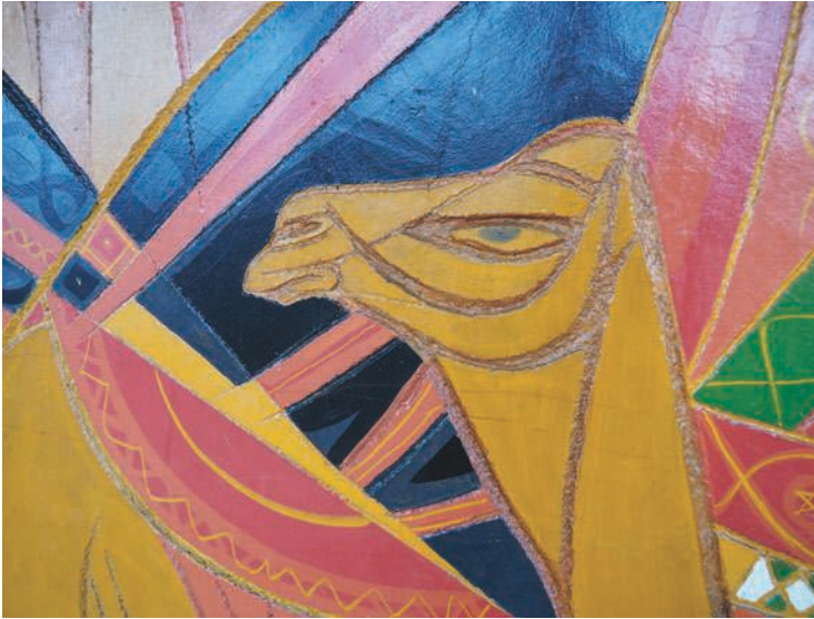
Fig. 15 – Salle de contrôle du TGO à Donges, détail de la fresque de Robert Lesbounit (ciment gravé et peint).