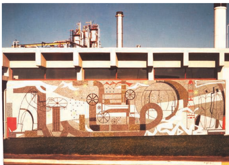
Fig. 13 – Raffinerie Antar de Vern-sur-Seiche, Histoire du pétrole (panneau 2), mosaïque, 1965.