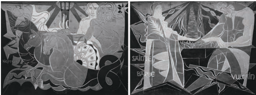
Fig. 8 – Unité de Paraxylène. À gauche, Neptune et Amphitrite , harmonie froide, ciment gravé et peint (70 m 2 ), 1960 ; à droite, Sainte Barbe chez Vulcain , harmonie chaude, ciment gravé et peint (70 m 2 ), 1960.