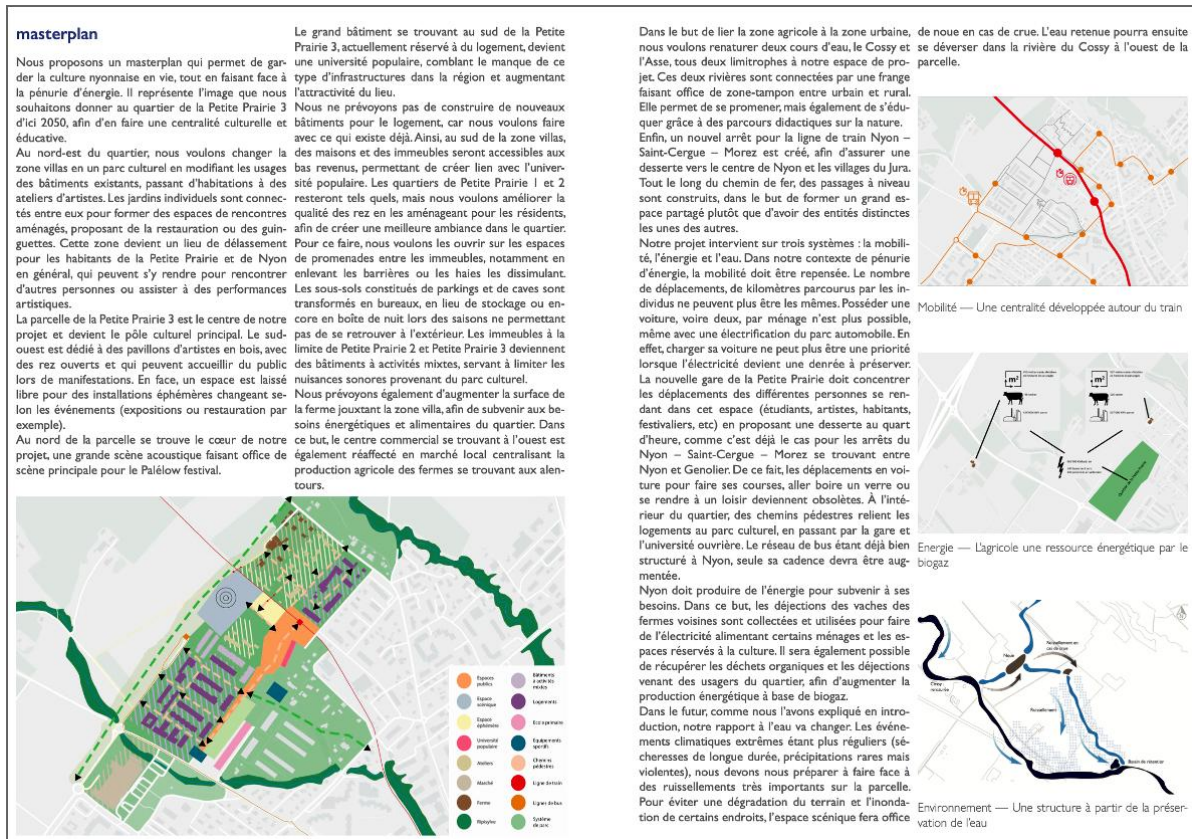
Figure 4. Projet Palélow : Phalanstery revisited ?

Crédits : H. Badan, G. Baranzini, S. Claivaz, A. Costa Pereira, C. Dubois et N. Elamly, « Palélow. Culture basse consommation », Rapport explicatif, 2022.