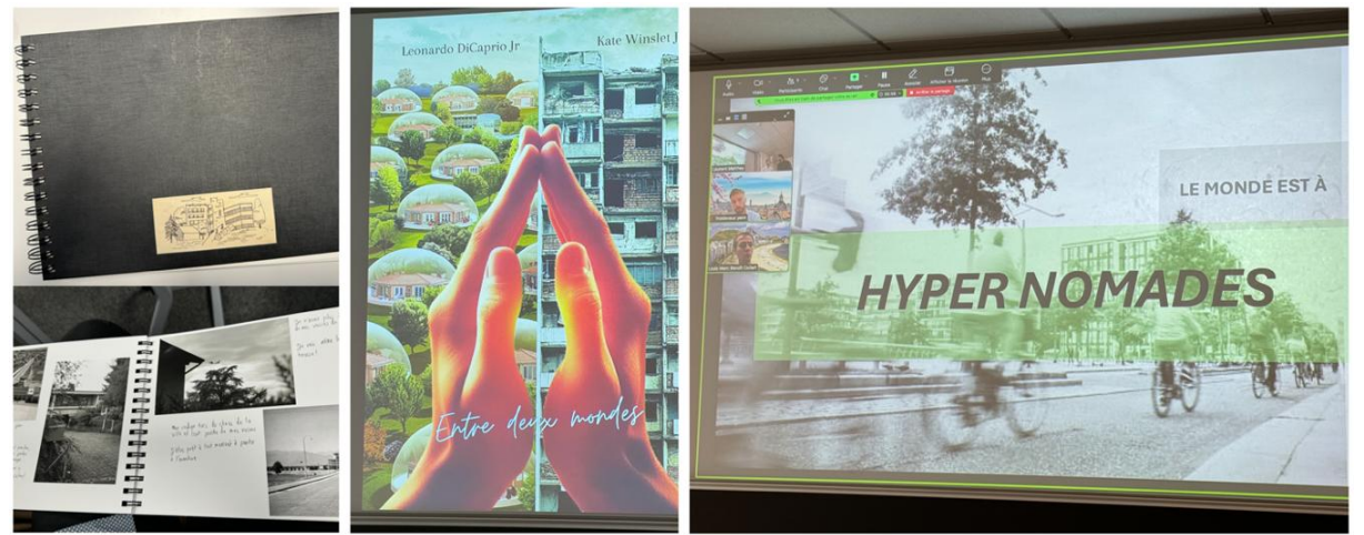
Figure 2. De l'album de famille au séminaire international en ligne, en passant par la rencontre avec les acteurs d'un hypothétique film : raconter autrement le projet

L'atelier entre, à partir de là, dans une phase qui est celle de l'exploration des possibles du monde anticipé par les différents groupes. Chacun testant ce qu'il adviendrait, en matière d'urbanisme, si (et nous citons ci-après quelques futurs envisagés lors des dernières éditions) : les autorités décidaient de rationner le nombre de mètres carrés réservés à chaque habitant-es (atelier 2021) ; les termes de l'urgence climatique décrétée par le Conseil d'Etat genevois étaient appliqués (2024) ; des aires urbaines étaient réservées à la déconnexion des habitants (2023)... Au terme de cet exercice, les participant·es restituent leurs visions de l'organisation territoriale en mobilisant une modalité de présentation dite créative (théâtre, film, jeu de simulation... – figure 2) au sens où elle s'écarte (sans les interdire – figure 3) des formats prescrits dans les autres ateliers du master (planches A0, rapport synthétique, supports PPT, présentation orale conforme aux attendus professionnels...).