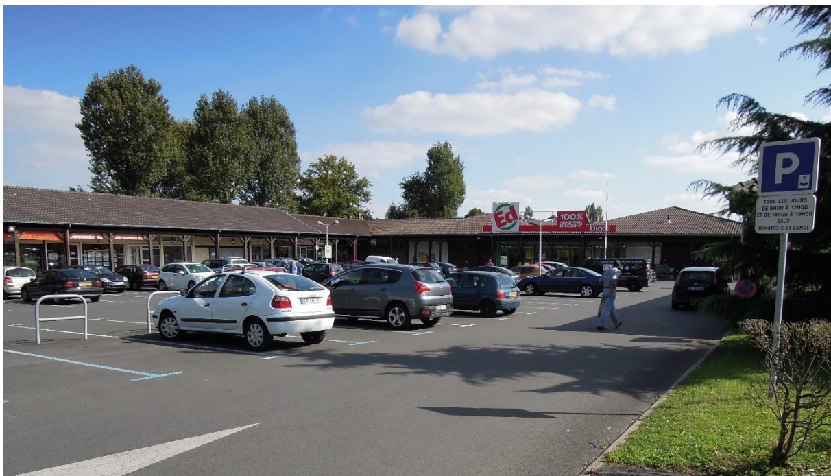
Cliché 2 : Le centre commercial du lotissement de Port-Sud à Breuillet. Un modèle d'organisation de l'espace aujourd'hui moins attractif pour les catégories aisées. De fait, l'enseigne à bas prix, Ed, a pris la place d'une enseigne plus haut de gamme