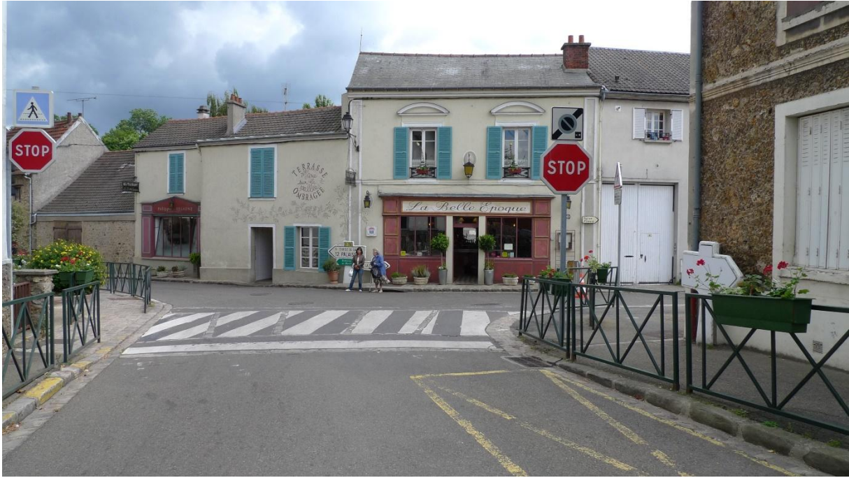
Cliché 3 : Le centre de Châteaufort. L'image de la ruralité traditionnelle possède aujourd'hui un fort pouvoir d'attraction

La valeur symbolique que les gentrificateurs accordent à leur cadre de vie ne dépend pas seulement de l'habitat et de l'architecture. Le commerce est aussi une dimension importante de l'image d'un lieu (cf. clichés 2 et 3). Plusieurs travaux (Benson et Jackson, 2013 ; Bacqué, Charmes et Vermeersch, 2014 ; Zukin, Kasinitz et Chen, 2015) soulignent le rôle des commerces et de leur évolution dans la gentrification. La question est en partie pratique (avec l'intérêt de pouvoir tout faire à pied, sachant que la chose est aujourd'hui perçue comme un attribut valorisant socialement). Elle est aussi symbolique (avec le rôle clé de l'infrastructure commerciale pour l'image d'un quartier).