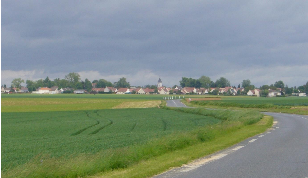
Cliché 1 : Un village périurbain typique de la Seine-et-Marne, Charny, 1200 habitants. Les habitants se représentent leur cadre de vie comme campagnard, avec le clocher et les champs autour du village. Cela étant, le paysage bâti est dominé par des extensions pavillonnaires construites à partir des années 1970

La captation de la rente foncière amenée par la périurbanisation est un enjeu massif, notamment à proximité des grandes villes. Ainsi, pour des terres céréalières, les valeurs de marché se situent généralement en dessous d'un euro le mètre carré et peuvent descendre jusqu'à 50 cents, alors qu'une fois à urbaniser le mètre carré vaut couramment 100 à 200 euros, si les réseaux urbains (électricité, eau notamment) arrivent en bordure de parcelle. Quand un hectare de terre agricole devient urbanisable, la plus-value est conséquente. Il y a certes quelques taxes, mais les plus-values restent belles, surtout pour les personnes propriétaires depuis plusieurs décennies, les taxes étant dégressives au fil de la durée de détention. Par ailleurs, ces taxes ne sont devenues significatives que depuis une dizaine d'années, bien après donc que la périurbanisation est devenue un phénomène marquant.