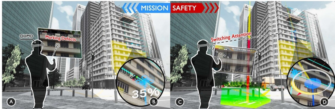
Figure 1: Exemple de visualisations selon le contexte en réalité augmentée.

Le projet SAFESPECT [1], propose de Nouvelles visualisation et interactions en réalité augmentée (simulé en VR) pour soutenir l'inspection de façade avec un drone. La démonstration permet de comparer plusieurs modes de télépilotage (tablette, réalité augmentée et réalité augmentée adaptative au contexte de sécurité) pour réaliser des tâches d'inspection de façades (Figure 1).