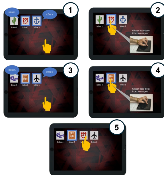
Fig. 2. Technique de couper/coller combinant interaction tactile et deux microgestes pour des personnes malvoyantes : couper de l'icône 2 et coller après l'icône 5.

Pour décider si l'icône A sera placée avant ou après l'icône B, il peut, après avoir effectué le SWIPE, déplacer son doigt dans trois zones possibles. La zone de gauche, qui s'étend du bord gauche de la tablette jusqu'au bord gauche de l'icône B, permet de déplacer l'icône A avant l'icône B. La zone de droite, qui s'étend du bord droit de la tablette jusqu'au bord droit de l'icône B, permet de déplacer l'icône A après l'icône B. La zone centrale permet d'annuler l'action, de sorte à ce qu'aucune réorganisation de la grille n'ait lieu. En levant son doigt de l'écran, l'utilisateur confirme l'action choisie selon la zone sur laquelle se trouve son doigt et la grille d'icônes est réorganisée. Figure 2 schématise cette technique d'interaction pour couper/coller une icône dans une grille d'icônes.