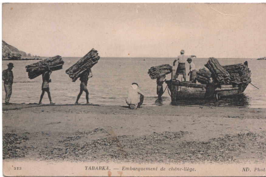
Illustration n°2 - embarquement de panneaux de liège (Tabarka)

récolte en liège de reproduction 38 . Des premières opérations de démasclage sur près de 2 000 hectares débutaient en 1846 avec l'aide de « travailleurs militaires 39 ».