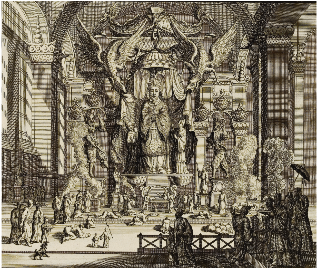
Figure 3. — « Matzou », Cérémonies et coutumes religieuses de tous les peuples du monde , vol. 4, p. 222a.

par ceux de l'image – Picart et Bernard avaient compris que les rituels définissaient l'homme dans son expérience de la religion bien mieux que les doctrines, qui lui demeuraient le plus souvent inintelligibles, quand elles n'étaient pas source de discorde, d'incompréhensions, de massacres et de guerres – à l'exemple proche des querelles de la grâce ou de la transsubstantiation qui avaient été la cause de tant de violences et de meurtres. Ainsi que le frontispice général de l'ouvrage l'exprimait avec un rare bonheur d'exécution graphique (voir The Book that Changed