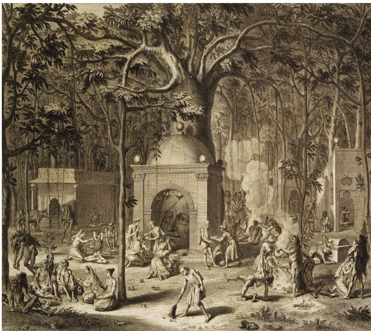
Figure 1. — « Diverses pagodes et pénitences des faquirs », Cérémonies et coutumes religieuses de tous les peuples du monde , vol. 4, p. 8b-8c.

ce grand texte. Leur travail retrace, avec science et conviction, l'histoire complexe de cette somme, relais précieux dans la diffusion d'une nouvelle manière de penser le « religieux » – sans jamais commettre l'anachronisme d'y voir un traité de religion comparée – à savoir la « connaissance séculière du sacré ». Les héritages de Spinoza (Bernard possédait une édition de ses œuvres complètes) et du « spinozisme » constituent l'un des chiffres secrets pour, comme le démontrent les trois auteurs, élucider l'enjeu des Cérémonies et coutumes religieuses , non seulement dans leur dimension textuelle mais aussi dans la mise en scène et les