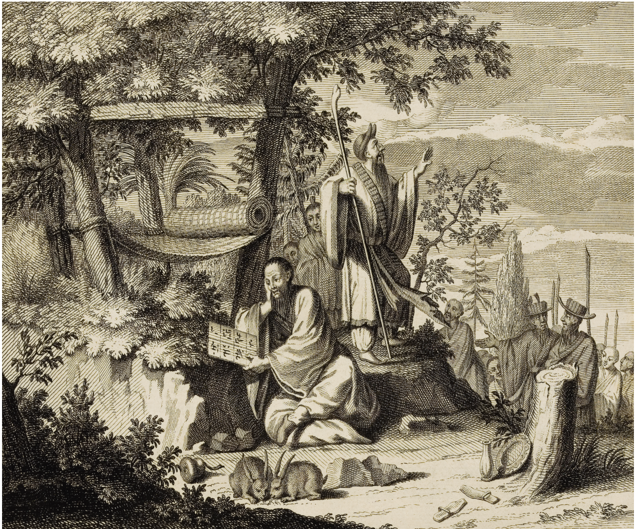
Figure 4. — « Magiciens et sorciers de la Chine », Cérémonies et coutumes religieuses de tous les peuples du monde , vol. 4, p. 238c.

virtualités de son art, Bernard fait preuve de discernement dans la manière dont il interprète les phénomènes religieux, y compris le quietisme qui devait exaspérer l'Église catholique française dans les années 1690. La comparaison lui permet de repérer des « invariants » entre les pratiques occidentales et celles des idolâtres d'Asie orientale :