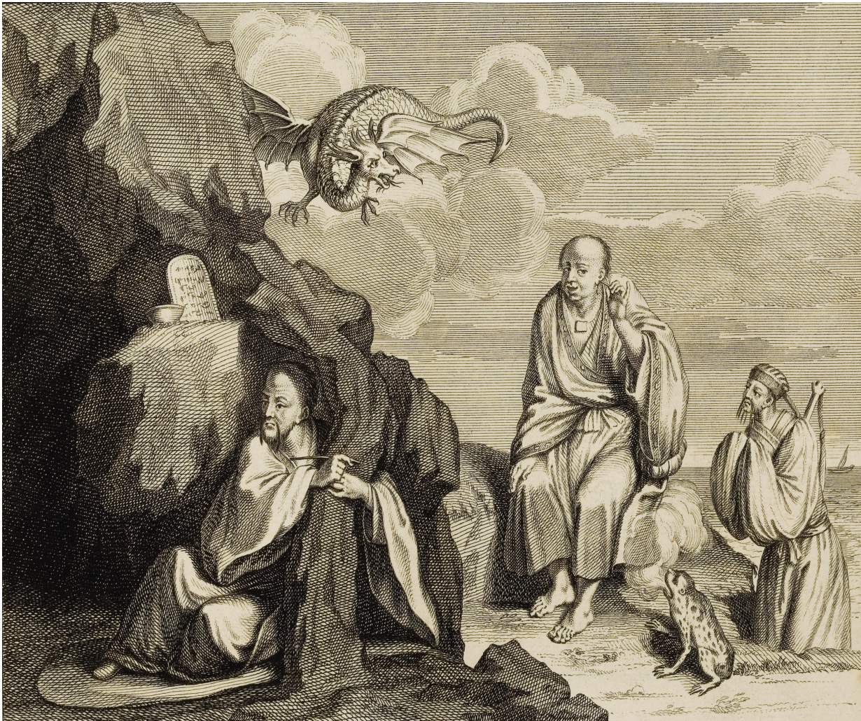
Figure 5. — « Autres magiciens et sorciers », Cérémonies et coutumes religieuses de tous les peuples du monde , vol. 4, p. 238c.

écoles (vantant notamment son sens de la coexistence et de la tolérance), les leçons de l'histoire des cérémonies religieuses telles que les présentent Picart et Bernard incitent à pratiquer les vertus de la comparaison, de l'ouverture savante et d'un « spinozisme nomade » bien conçu, qui est tout sauf un simple athéisme.