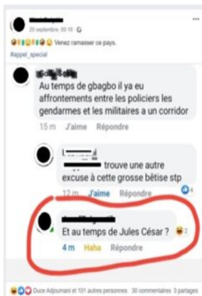
Exemple 3. Technoconversation rapportée, Facebook, affichage du 18 octobre 2019

La technoconversation rapportée est un processus citationnel qui fonctionne sur le modèle du technodiscours rapporté répétant par capture d'écran. Elle commence par une sorte de thésaurisation, c'est-à-dire une opération de stockage permise par le smartphone et facilitée par la capture d'écran. Il s'ensuit un processus de mise en discours qui comprend l'étape de l'insertion d'une ou de plusieurs captures d'écran non point comme illustrations, mais plutôt comme parties constitutives d'une conversation numérique écrite à rapporter (partiellement ou totalement) dans le strict respect écologique de la configuration originelle. La technoconversation rapportée consiste donc à publier ou republier une conversation numérique écrite privée issue d'une fenêtre de discussion instantanée (exemple 2) ou un échange semi-public (commentaire suivi de réponse) réalisé dans l'« espace d'exposition [techno]discursive » (Develotte,