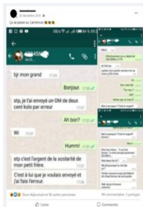
Exemple 2. Technoconversation rapportée, Facebook, affichage du 12 novembre 2020