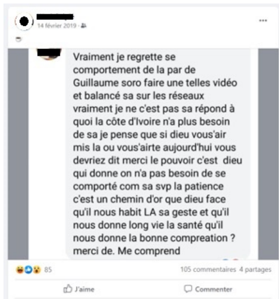
Exemple 4. Récupération techno-énonciative, Facebook, affichage du 13 novembre 2020

Dans cet exemple de technodiscours rapporté, les marqueurs de l'identité déclarative de l'énonciateur numérique cité sont rognés. Pour rappel, les socionautes font usage de certaines techniques d'anonymisation de l'identité numérique (par rognage, floutage ou gribouillage) dans une optique éthique relative à la protection de l'identité de l'énonciateur numérique cité. Ce principe n'est pas forcément applicable aux contenus diffusés par/sur certaines personnes jugées publiques (chanteur·trice·s, musicien·ne·s, footballeur·euse·s, etc.) qui utilisent le technodiscours rapporté et la fractalité des réseaux sociaux numériques comme biais d'augmentation de leur capital