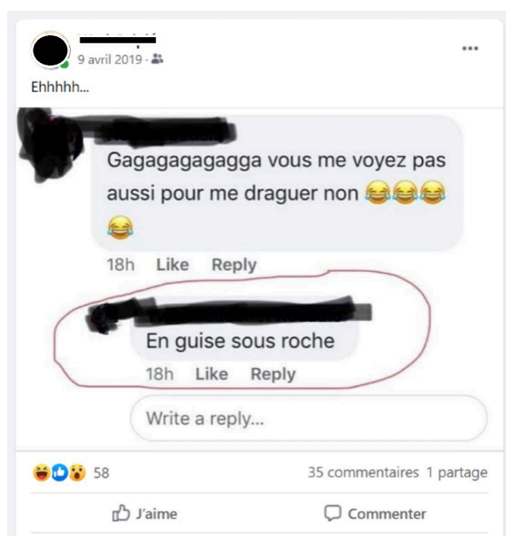
Exemple 5. Focalisation techno-énonciative, Facebook, affichage du 13 novembre 2020

Dans l'exemple 5 ci-dessous, la déixis numérique révèle des manières proprement numériques de pratiquer la focalisation dans les technodiscours rapportés par capture d'écran. Elle met au jour deux niveaux de focalisation techno-énonciative qu'il convient d'expliciter non sans en avoir donné la définition et les caractéristiques.