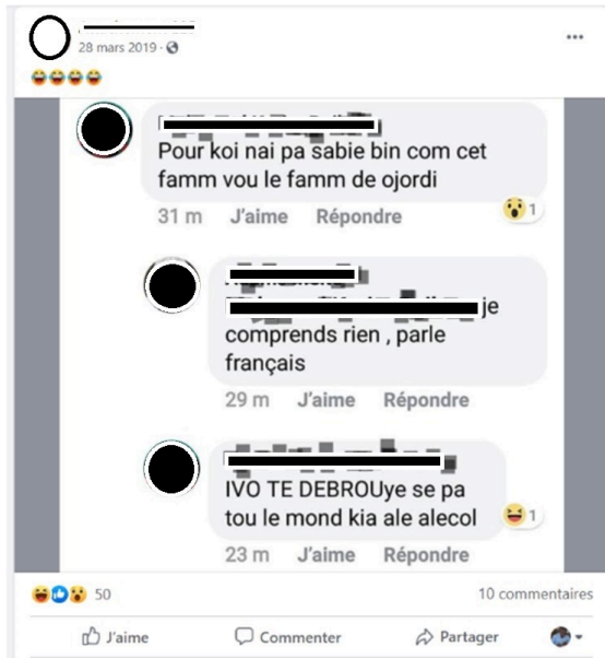
Exemple 6. Modalisation techno-énonciative, Facebook, affichage du 13 novembre 2020

partir duquel l'énonciateur numérique citant introduit le technodiscours rapporté ou la technoconversation rapportée dans un contexte nouveau.