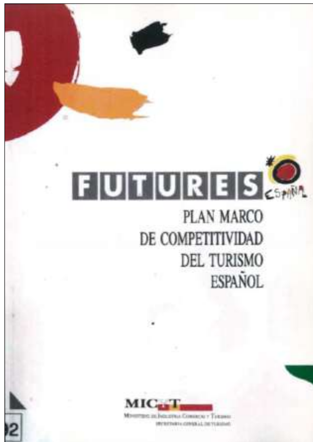
Figure 1 « Futures », Plan Marco de Competitividad del Turismo Español, ministère de l’Industrie et du Tourisme, 1992-1996