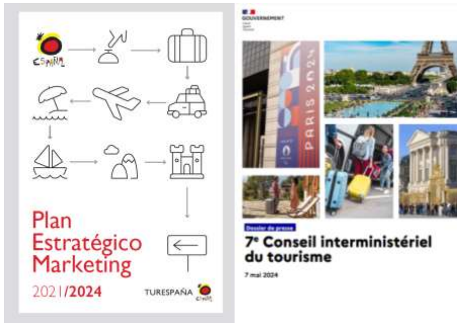
Figures 2 et 3 : Des territoires, des mobilités, des événementiels (JOP Paris 2024). TUESPAÑA, 2021, page de garde du rapport, 7 e Conseil interministériel du Tourisme, page de garde 2024.

L'Espagne s'appuie sur une grille fine de profils touristiques et d'espaces, intégrant les segments LGBTQ+, luxe ou famille dans une stratégie différenciée par destination, elle agit par ajustements ciblés alors que la France pense « transformation globale » dans le cadre d'une vision étatique devant se reprendre entre les différents territoires.