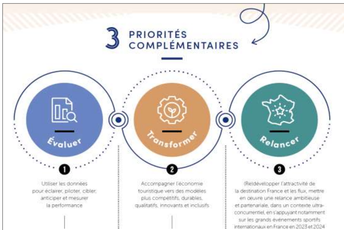
Figure 4 : « 3 priorités complémentaires : évaluer, transformer et relancer ». Feuille de route 2022-2024, Destination France, Atout France, p.10

La gestion des données peut être une solution à cette gestion des flux, ce qui frappe, dans les propos des différents documents français, est l'allusion constante à la capacité de mesure des activités et des traces numériques des touristes internationaux, pour ouvrir les territoires, créer de nouveaux produits et mettre en avant une forme de remise en question du modèle de pays de transit. La solution durable passe par la captation des données et leur analyse par tous les acteurs du tourisme en France. D'ailleurs, le schéma, « 3 priorités complémentaires : évaluer, transformer et relancer » est symptomatique du nouveau réflexe à mettre en place pour l'Hexagone.