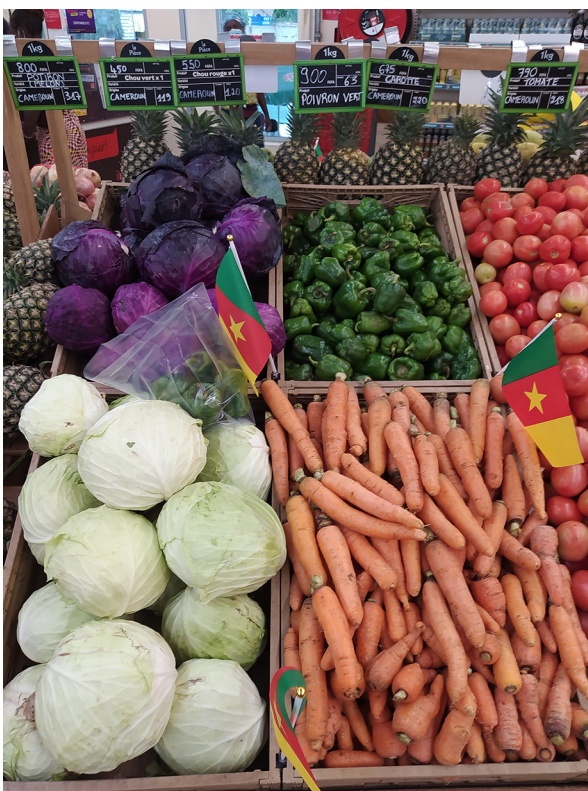
Figure 4. Rayon fruits et légumes, Carrefour Douala (Jourda, 2023)

Les fruits et légumes frais sont positionnés dès l’entrée du magasin dans la zone des « 50 premiers pas ». L’objectif de cet aménagement commercial est d’inciter l’achat de ces marchandises. Les supermarchés d’origine occidentale se concentrent près des quartiers d’affaires et résidentiels des populations les plus riches, en particulier les expatriés. Ils sont situés autour des quartiers Bonapriso, Bonanjo et Bali. Certains espaces sont partagés entre supermarchés d’origine occidentale et camerounaise/libanaise, comme au quartier Akwa, cœur commercial de la ville. À Bonamoussadi, l’implantation des deux types de supermarchés s’explique par l’influence de la nouvelle classe aisée, attirant ainsi les investisseurs marchands de toute la ville, créant une densité commerciale particulièrement importante : marché classique, supermarchés d’origine française (Carrefour, Super U) et d’origine indienne (Mahima). De nouveaux espaces commerciaux ouvrent dans les quartiers d’urbanisation récente (Logpom, Bonabéri), indiquant leur attractivité. La distribution des supermarchés révèle une certaine géographie sociale de la métropole, ils s’implantent là où vivent les classes de consommation supé-