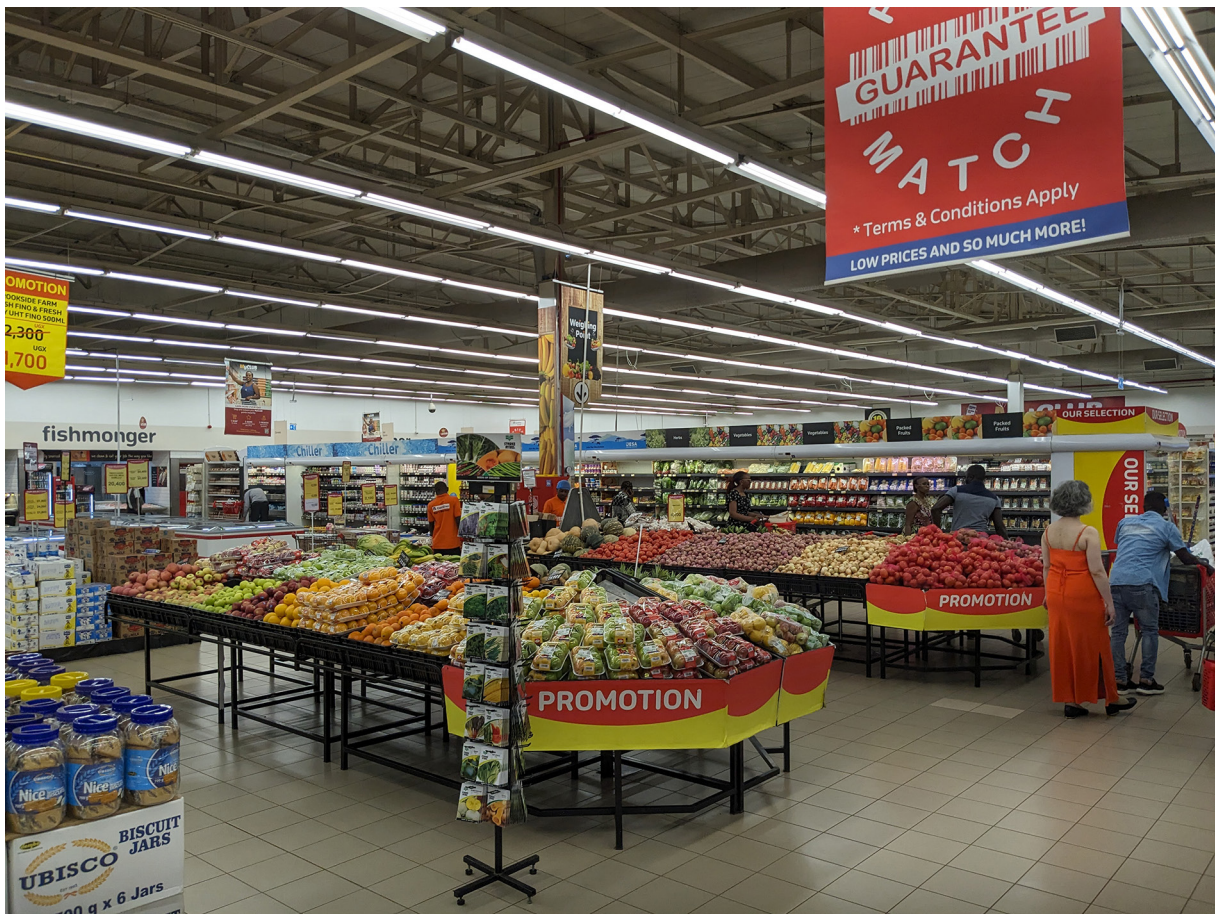
Figure 3. Rayon fruits et légumes, Carrefour Lugogo, Kampala (Rcaud, 2023)