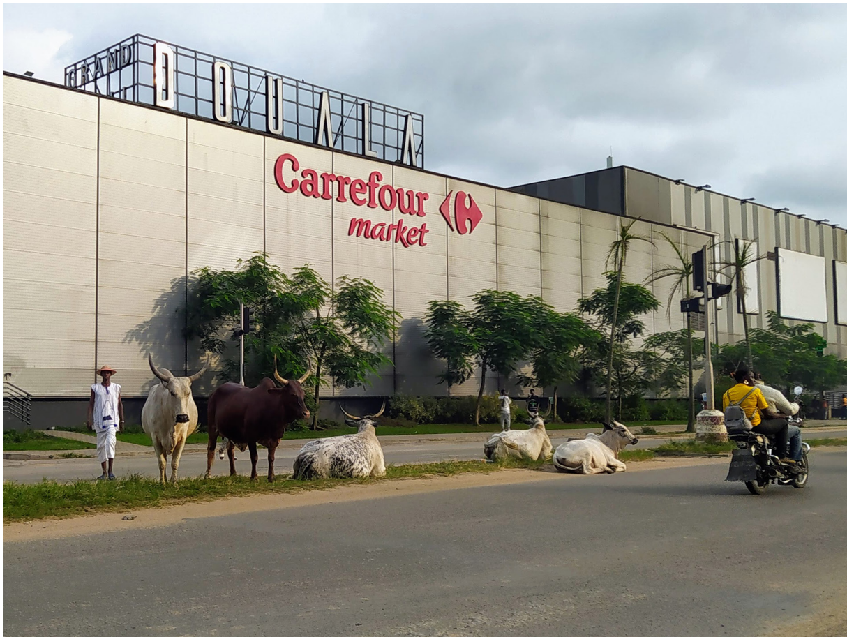
Figure 6. Carrefour Grand Mall, Douala (Jourda, 2023)