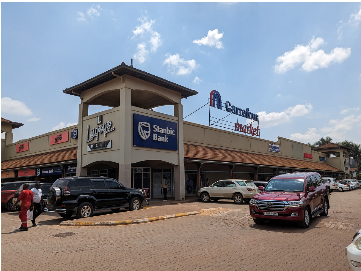
Figure 8. Carrefour Lugogo

À Kampala, les mesures de libéralisation économique dans les années 1990 ont favorisé les investissements directs étrangers que le développement de chaînes régionales de supermarchés illustre. Metro et Cash and Carry, en provenance d’Afrique du Sud, sont les précurseurs, suivis au début des années 2000 par Shoprite et Game. Uchumi et Nakumatt, enseignes kényanes, sont respectivement arrivées en 2002 et 2009. De nombreux supermarchés ougandais ont vu le jour au tournant du siècle, dont les trois principales enseignes : Capital Shoppers, Quality Supermarket et Standard Supermarkets. Ces enseignes sont établies uniquement à Kampala et ont trois magasins chacune, dans une métropole où se créent régulièrement de nouveaux supermarchés locaux. Si des supermarchés voient le jour, des enseignes internationales ferment sur fond de mauvaise gestion et de faillite. Les marques emblématiques kényanes ont quitté l’Ouganda, Uchumi en 2015, Nakumat a fermé ses neuf magasins kampalais en 2017. En 2021 et 2022, les enseignes sud-africaines (Shoprite et Game,) se sont repliées dans leur pays d’origine. Ces échecs ont offert des opportunités dont Carrefour s’est saisi. La marque française