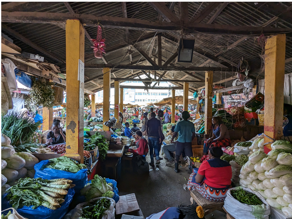
Figure 1. Marché de Nakasero (Rcaud, 2023)

Les supermarchés ont des infrastructures beaucoup plus intensives en capital, ils utilisent par exemple des réfrigérateurs pour une partie des produits frais (dont des légumes et des fruits). Les chaînes de supermarchés proposent des produits alimentaires et non-alimentaires, elles se distinguent notamment par la diversité des produits, par les prix, par le soin apporté à l’« expérience commerciale » du client dont des pratiques marketing importées comme la carte de fidélité proposée par Carrefour. Cette enseigne est présentée par la presse et perçue par les clients et employés (qui bénéficient de conditions de travail plus avantageuses que dans les marques nationales) comme un magasin premium, avec plus de 20 000 produits. La surface consacrée aux fruits et légumes, organisée en rayonnages horizontaux et rayonnages verticaux réfrigérés, avoisine 50m 2 pour le plus grand magasin, ce qui est finalement peu. Le nombre de caisses varie de 5 à 10, les surfaces sont comprises entre 1500m 2 et 2800m 2 pour la