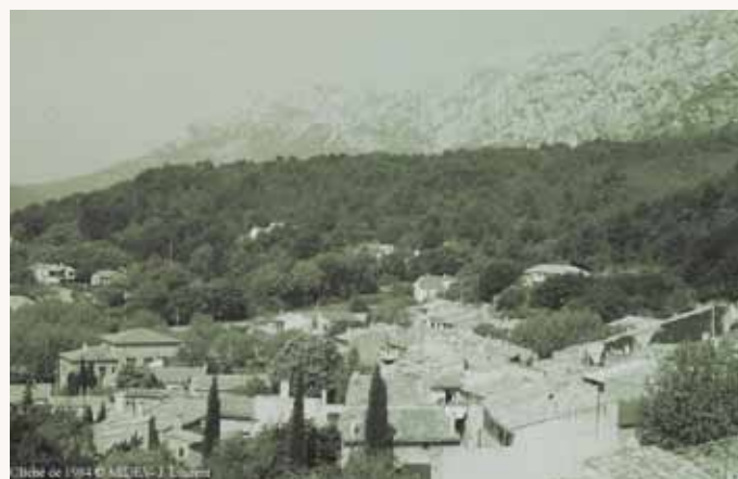
La densité du couvert végétal : un indice des changements de l'activité humaine. Au début du siècle, le pied sud de la Sainte-Victoire était peu boisé en raison de l'activité agricole et de la production de charbon (charbonnières). L'abandon de ces pratiques a entraîné une recolonisation du massif par la végétation.

De ce fait, l'étude de l'évolution des milieux en contexte archéologique, répond à différents objectifs :