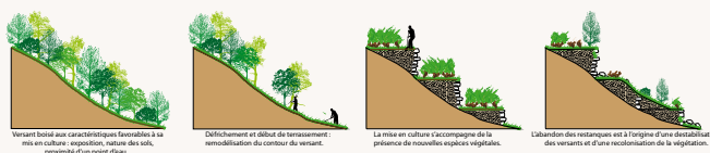
L'impact de l'homme sur son milieu : l'exemple des terrasses de culture ou restanques.