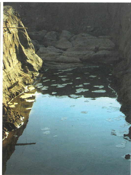
Portion de la côte rocheuse au changement d'ère entraperçu dans un sondage préalable à la construction du théâtre d'agglomération.

Depuis la ligne de rivage du milieu du 1 er siècle après J.-C. jusqu'à l'actuelle, située 1,3 km plus loin, la progradation littorale s'est considérablement ralentie. Progressivement, elle se stabilise et la côte prend la forme concave actuelle.