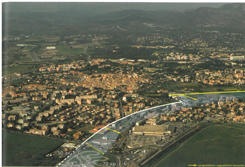
Trait de côte et son avancée entre le milieu du 1 er siècle avant J.-C. et la fin du 1 er siècle après J.-C. DAO P. Excoffon, J. Pâques, photo M. Heller, service du Patrimoine de la ville de Fréjus.