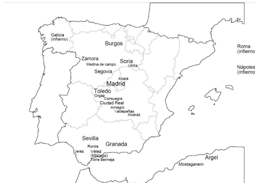
Fig. 1. El mapa de la Germanía de Quevedo

Este mapa germanus (fig. 1), por cierto, literario y poetizado, resulta no distar tanto del mapa mundus pues, en efecto, sabemos por archivos historiográficos que los rufianes repartían el año en dos núcleos geográficos que eran Madrid y Sevilla, junto con sus vecindades más o menos alejadas.