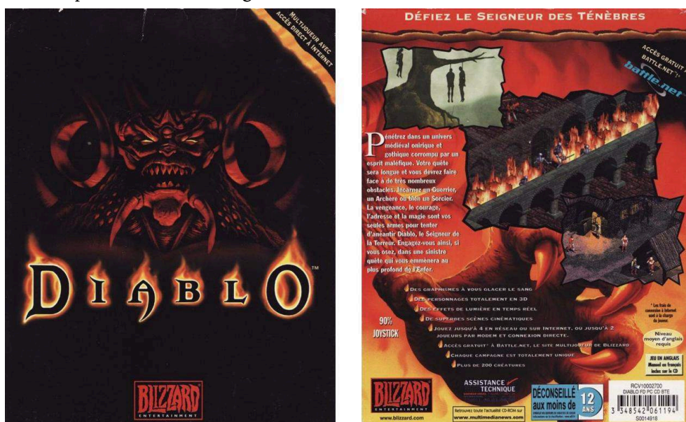
Illustration 5. Boîtier recto-verso français du jeu Diablo (1997).