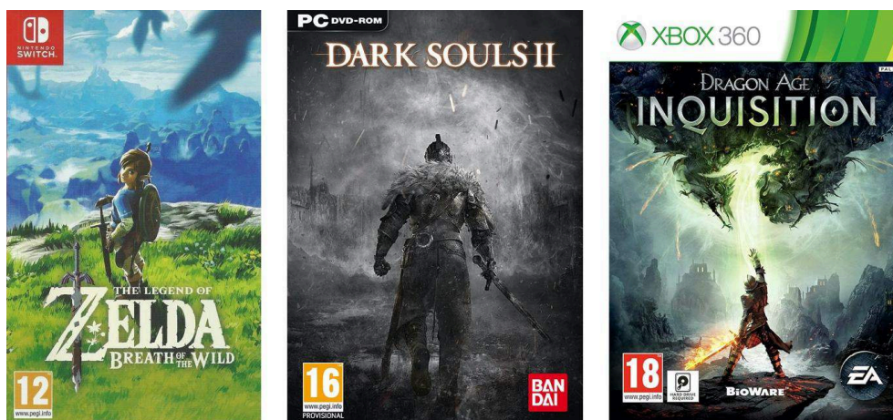
Illustration 9. Boîtiers des jeux The Legend of Zelda : Breath of the Wild (2017), Dark Souls 2 (2014) et Dragon Age : Inquisition (2014).