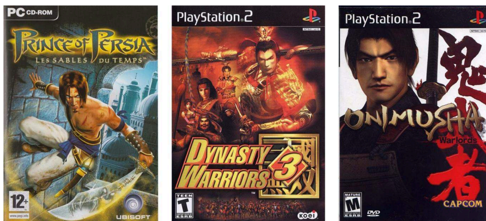
Illustration 7. Boîtiers des jeux Prince of Persia : Les Sables du Temps (2003), Dynasty Warriors 3 (2001) et Onimusha (2001).