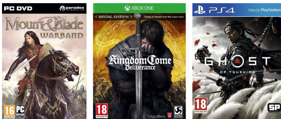
Illustration 8. Boîtiers des jeux Mount & Blade : Warband (2010), Kingdom Come : Deliverance (2018) et Ghost of Tsushima (2020).