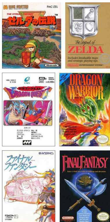
Illustration 2. Boîtiers japonais (à gauche) et américains/européens (à droite) des jeux The Legend of Zelda (1987), Dragon Warrior (1989) et Final Fantasy (1990).