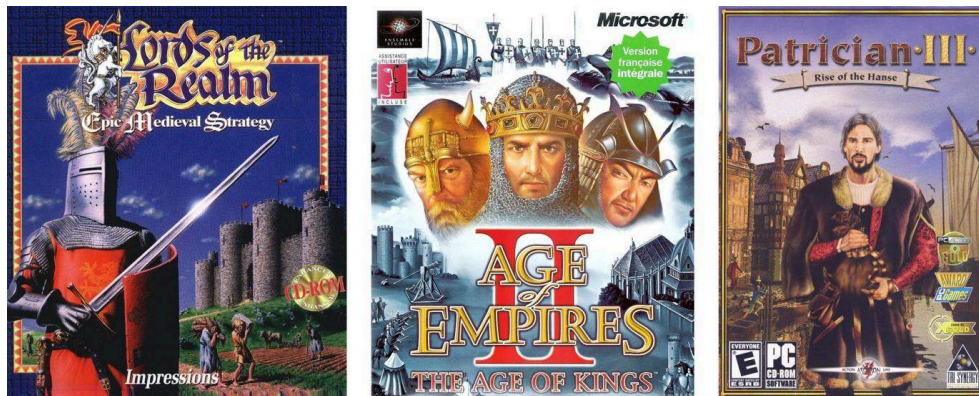
Illustration 6. Boîtiers des jeux Lords of the Realm (1994), Age of Empires 2 (1999) et Patrician 3 (2003).