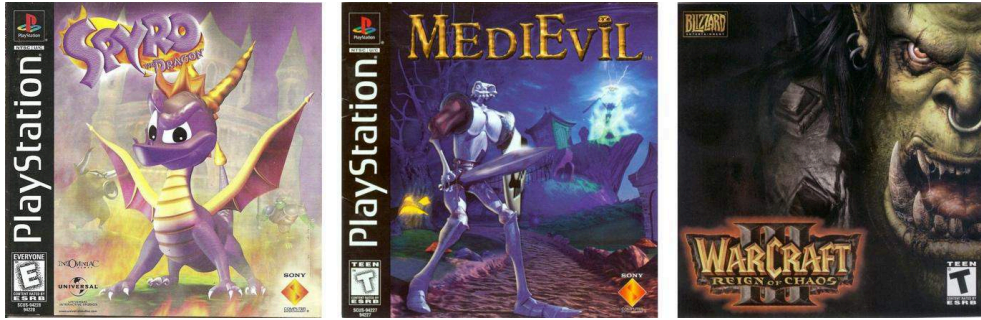
Illustration 3. Boîtiers des jeux Spyro (1998), MediEvil (1998) et Warcraft 3 (2002).