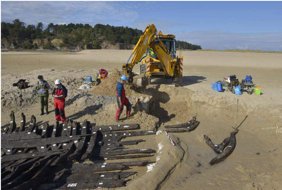
Fig. 2 – Vue générale des vestiges et leur position en plage