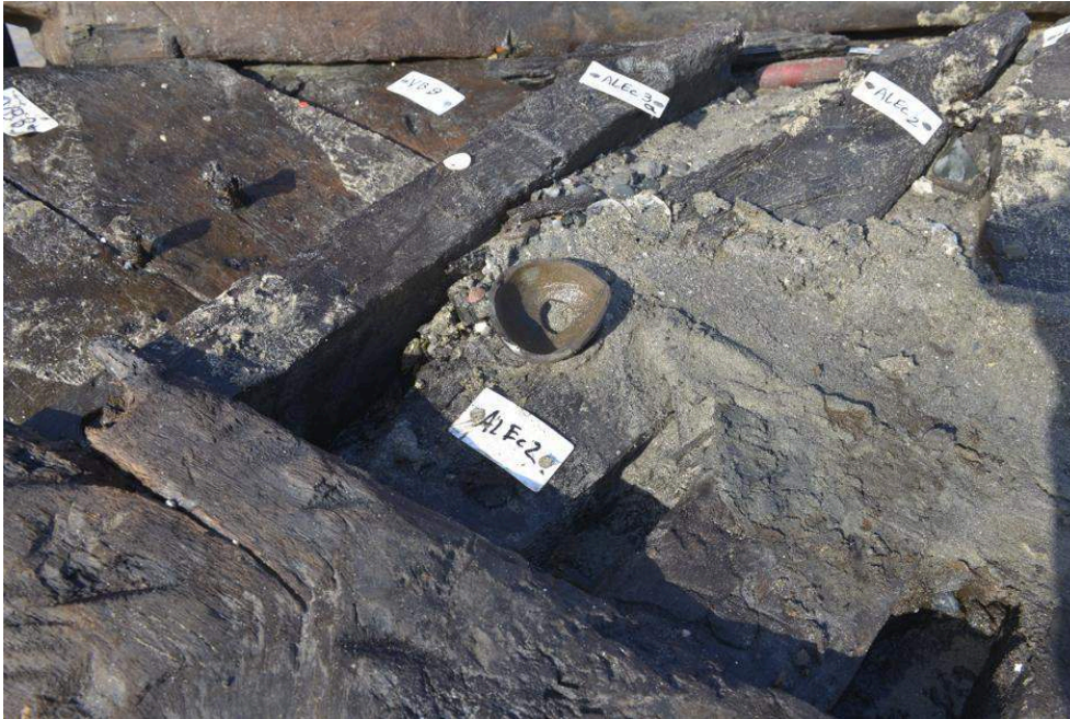
Fig. 3 – Découverte étonnante après le démontage des fourcats couchés