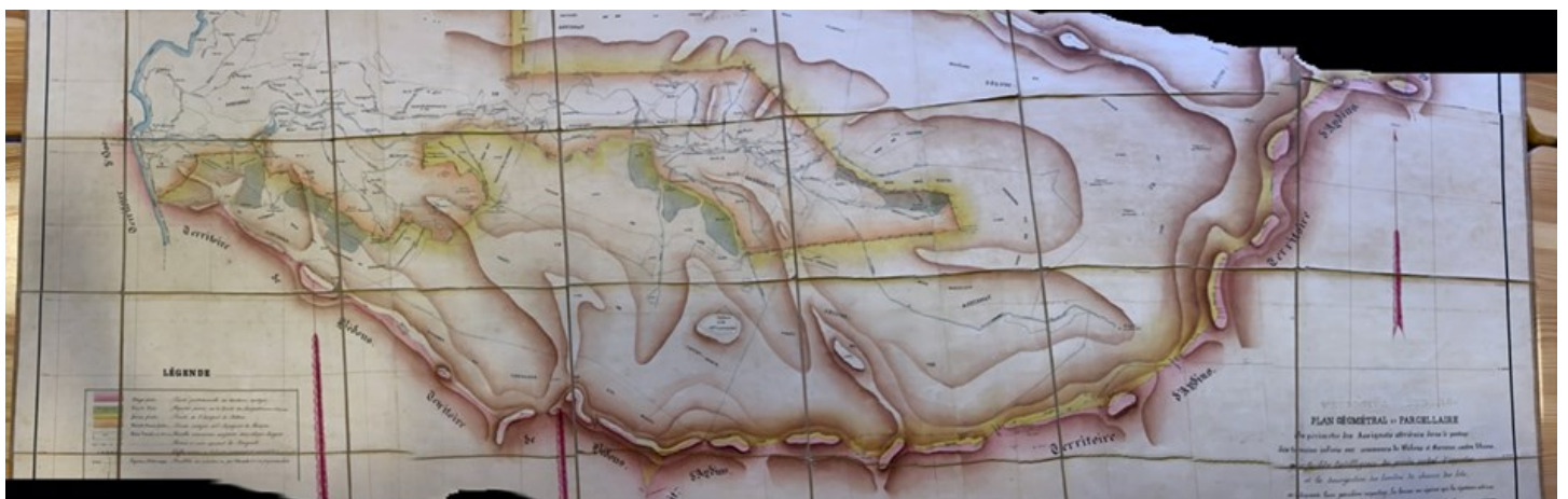
Plan Géométral et parcellaire, Assignat de Bedous, par le Géomètre en Chef, et annexé par les Experts soussignés à leur procès-verbal, A Pau, le 31 juillet 1865

Sur la commune de Bedous, l'accès aux estives a aussi constitué une importante source de conflits entre les communautés pastorales, en particulier à partir de 1778, lorsque Sarrance s'est constituée en une paroisse distincte de Bedous. A la suite d'un jugement rendu par le tribunal d'Oloron le 15 juillet 1854 6 , les Conseils municipaux des communes riveraines ont engagé des délibérations qui les ont conduits à engager en 1863 une procédure de cantonnement des usages pastoraux. Des experts géomètres ont alors été mandatés par le Préfet pour « procéder aux opérations matérielles du partage » et mettre fin aux indivisions entre les communes. Ceux-ci ont dressé le plan cadastral des parcelles grevées de « servitudes réciproques », « actives et passives » sur chacun des territoires administratifs des communes concernées afin d'établir « l'abornement définitif des dites montagnes ou quartiers ». Ces cartes, établies à Pau les 31 juillet 1865 et 3 juillet 1866 attestent, parfois en