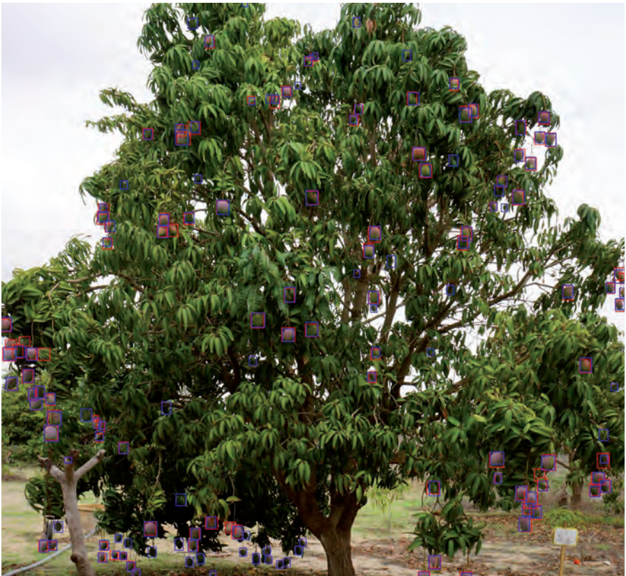
Détection automatique des mangues par intelligence artificielle à partir d'une photo de smartphone.

générique permettant diverses particularisations à des formalismes spécifiques tels les réseaux de Petri, les automates cellulaires et plus généralement les modèles à pas de temps fixe. Le formalisme mathématique des réseaux de Petri est plus particulièrement apprécié pour sa capacité à représenter la synchronisation de processus exécutés en parallèle et pour les possibilités d'analyse rigoureuse des modèles. Un automate cellulaire est constitué d'un réseau de cellules discrètes et est tout-à-fait approprié pour représenter une dynamique spatiale (par exemple la propagation d'une infestation) et des phénomènes d'auto-organisation (par exemple les dynamiques paysagères de reboisement naturel). Certains formalismes tels que les statecharts (Léger et Naud, 2009), les automates temporisés (Hélias et al., 2008) et les réseaux de Petri (Guan et al., 2008) peuvent aussi se prêter à des procédures de vérification du comportement (par exemple pour s'assurer que le modèle ne peut pas se bloquer) ou des propriétés temporelles du modèle.