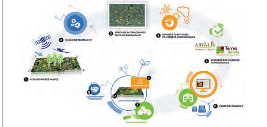
Figure 1 : Farmstar, de l'image spatiale haute résolution aux cartes de conseils

Farmstar fait partie des OAD basés sur des images spatiales à résolution infraparcellaire. Il a été développé par Airbus en collaboration avec les instituts techniques agricoles. La chaîne de traitement est ici complexe puisqu'elle mêle l'utilisation d'images spatiales avec d'autres sources de données comme les données climatiques et qu'elle mobilise la simulation informatique de modèles agronomiques. Le résultat est mis à disposition via des API (Application Programming Interface) qui sont interrogées par l'application utilisateur. L'agriculteur accède ainsi aux informations utiles sous forme de cartes et d'indicateurs « tableau de bord » via une application web intégrée qui masque l'architecture informatique complexe et les flux de données mobilisés.