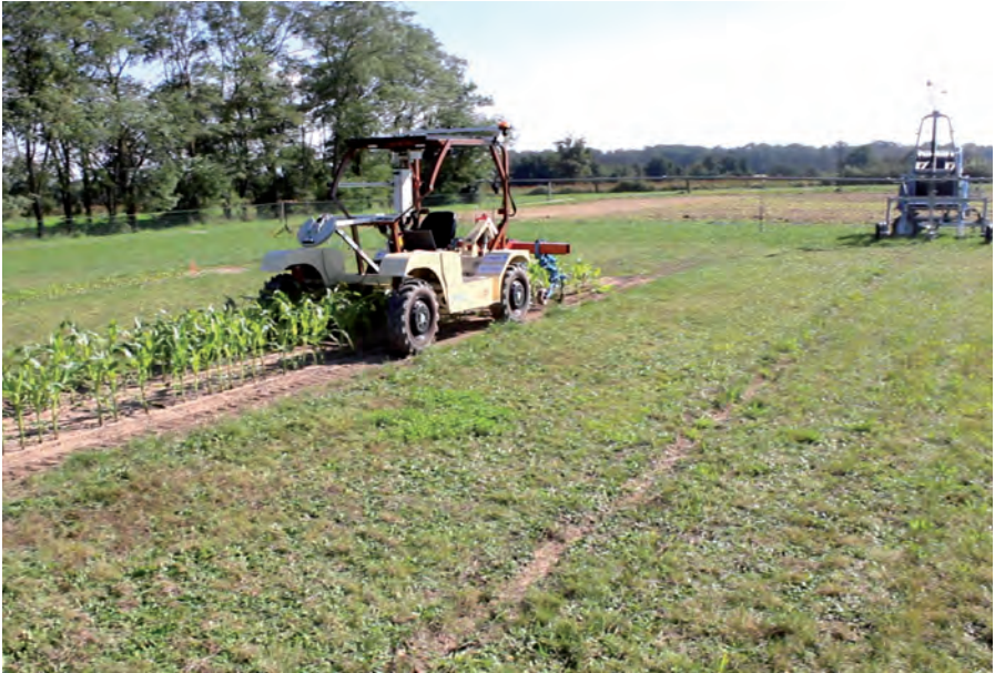
Étude d'un tracteur électrique robotisé pour l'agroécologie.

l'absence d'un superviseur embarqué impose de doter une machine autonome de moyens de perception pour garantir la sécurité (éviter d'obstacles, gestion de la traversabilité).