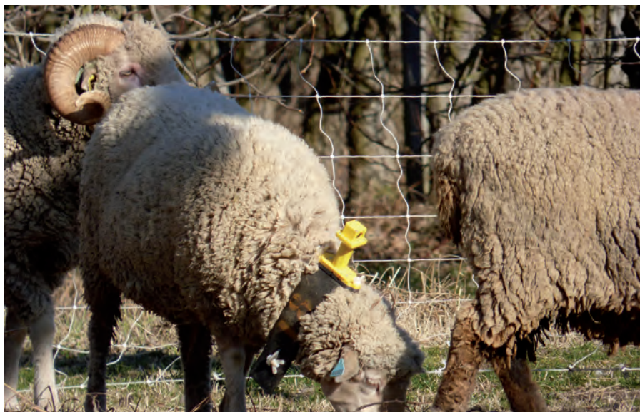
Suivi des animaux en élevage extensif © Selmet – CIRAD.

La plupart des capteurs sans liaison filaire reposent sur une énergie limitée (par exemple batterie) et/ou variable (par exemple via un capteur solaire) qu'il faut donc préserver. La transmission de la donnée est souvent le facteur le plus consommateur d'énergie et l'un des plus gros défis. On cherchera donc à limiter la quantité de données à envoyer tout en maintenant une fréquence d'envoi nécessaire au bon fonctionnement de l'application. Les recherches se concentrent alors sur le traitement de la donnée dans le capteur, lui-même contraint en capacité de calcul et de mémoire : agrégation spatiale et/ou temporelle des données ( Salim et al., 2020 ) ainsi que sur des méthodes d'intelligence artificielle allégées. Par exemple, on exploite la corrélation entre deux grandeurs (comme température et humidité) afin de ne transmettre qu'une des deux valeurs et interpréter la seconde. On peut aussi prédire localement la prochaine valeur mesurée, et ne la transmettre que si elle ne correspond pas à la valeur prédite. Plus une application est exigeante en résolution temporelle ou en précision, plus on devra effectuer d'envois. Il y a donc là aussi un compromis à considérer entre efficacité, précision et coût.