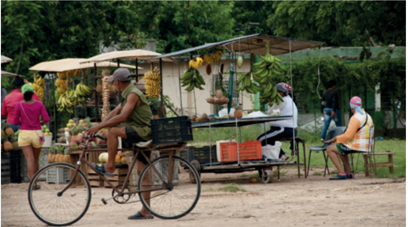
Marché aux fruits, Cuba

restent marginales comparées à la production et aux besoins alimentaires actuels. De plus, l'agriculture urbaine ne peut répondre à tous les besoins alimentaires et le phénomène doit donc être relativisé. Même en prenant en compte l'agriculture périurbaine, le maraîchage domine alors que cela ne représente qu'une petite partie de notre alimentation. Les cultures céréalières ou oléagineuses sont presque inexistantes en ville par exemple.