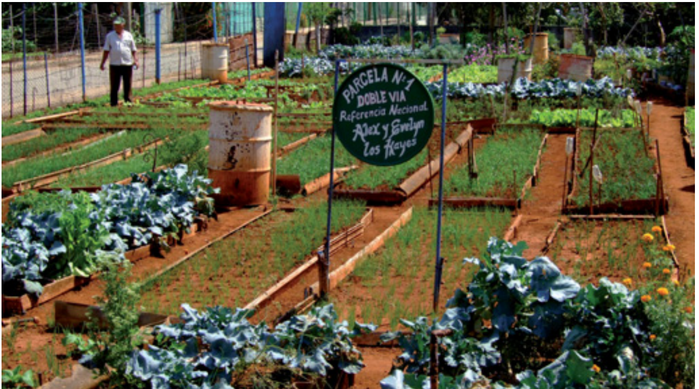
Installation d'agriculture urbaine en banlieue de la Havane

L'agriculture urbaine constitue également un potentiel d'innovation intéressant. Elle change par exemple le regard sur le métier d'agriculteur. Souvent transmis de « père en fils », le métier souffre d'une crise de vocations. L'agriculture urbaine voit naître de nouveaux types d'agriculteurs, aux profils atypiques. Parfois, leur stratégie n'est pas de le rester à vie. Ils peuvent considérer l'activité pour une période donnée, un projet parmi d'autres dans un parcours, une expérience. Si la vision de la profession qu'ils portent, parfois involontairement, peut attirer les critiques des agriculteurs « traditionnels » pour des raisons diverses, elle permet a minima de changer le regard du public sur les producteurs et de recréer des ponts entre la ville et la ruralité.