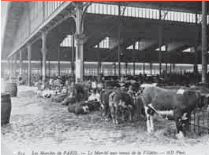
Fig. Les Marchés de PARIS. — Le Marché aux herbes de la Villette.

Montpellier SupAgro, secrétaire général de la Chaire UNESCO Alimentations du monde