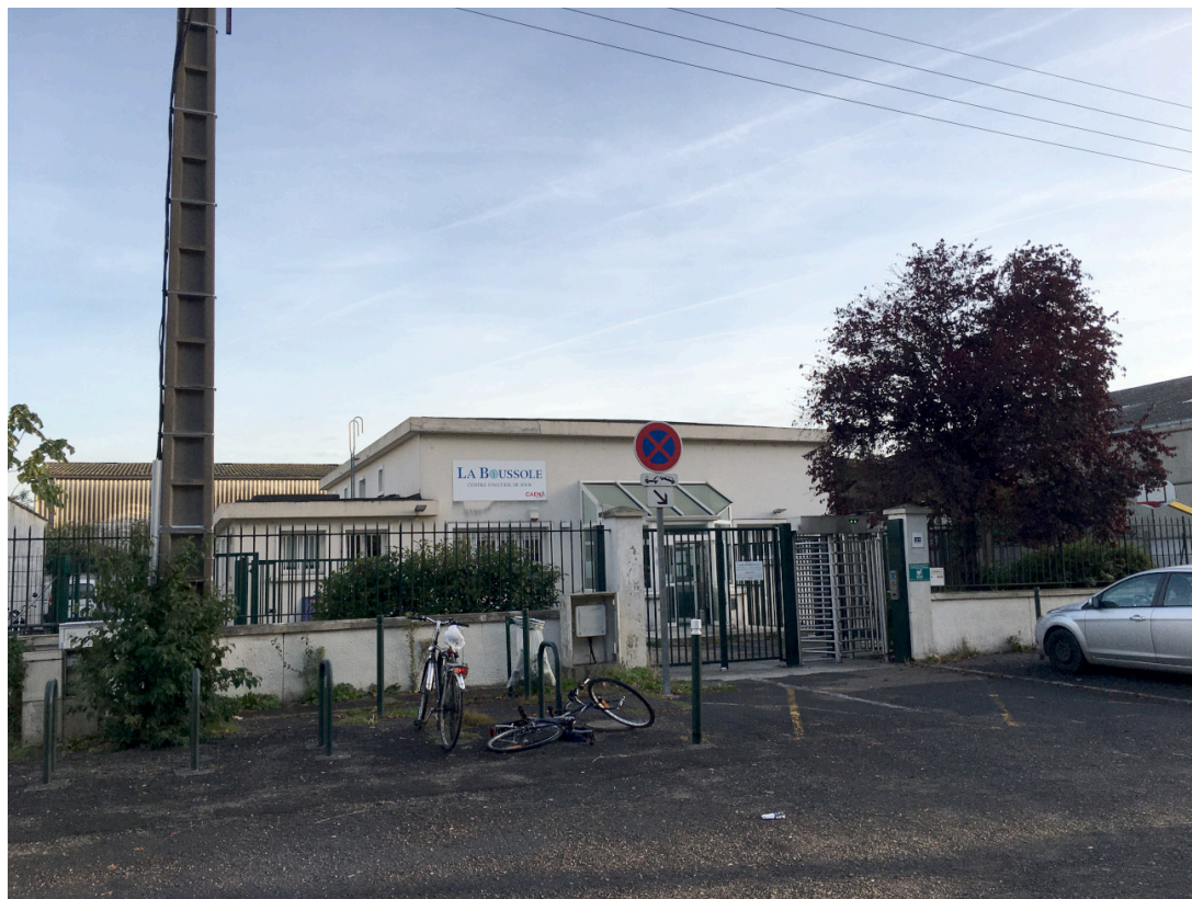
Photo 1 : Le centre d'accueil de jour La Boussole sur la Presqu'île

Plusieurs structures accueillent, pour une nuit ou plus, les personnes en difficultés. Outre la mise à l'abri et le repos, ces structures peuvent proposer des consignes individuelles, des douches, une laverie, un café, un micro-onde ou encore des dons alimentaires et de vêtements, des services médicaux, un soutien à la scolarité, des conseils et orientations, des journaux, des livres, des animations, un chenil, etc. À Caen, La Boussole est une structure d'accueil de jour, gérée par le Centre communal d'aide sociale (Ccas) de la ville de Caen pour les personnes seules, hommes ou femmes, en grande précarité, souvent SDF ou victimes de violences. Le Service d'accueil et d'accompagnement social (Saas), à Caen, de l'association Itinéraires Caen-Lisieux, accueille dans la journée des femmes enceintes ou accompagnées d'enfants mineurs, certaines victimes de violences conjugales.