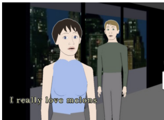
Figure 4. Façade. (c) Michael Mateas and Andrew Stern

ward Albee. Le joueur/spectateur joue le rôle d'un ami qui rend visite à un couple. La conversation est amicale au début mais révèle peu à peu les tensions dans le couple [43]. Le joueur se déplace dans l'appartement et communique avec Trip et Grace à l'aide du clavier. La trame narrative est programmée dans le langage ABL et exécutée en temps réel [42].