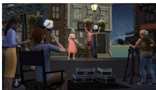
Figure 5. The seagull in the Sims

ward Albee. Le joueur/spectateur joue le rôle d'un ami qui rend visite à un couple. La conversation est amicale au début mais révèle peu à peu les tensions dans le couple [43]. Le joueur se déplace dans l'appartement et communique avec Trip et Grace à l'aide du clavier. La trame narrative est programmée dans le langage ABL et exécutée en temps réel [42].