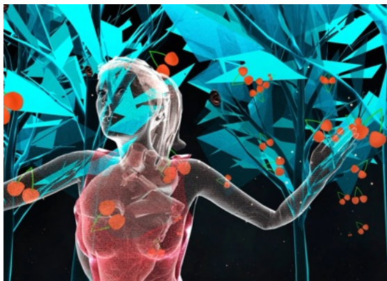
Figure 10. Virtual Parsifal

Dans la mise en scène de Parsifal par le metteur en scène (et professeur au MIT) Jay Scheib à Bayreuth en 2023, les décors et acteurs virtuels sont projetés dans les visiocasques des spectateurs [23, 27, 67]. L'utilisation de la réalité augmentée ouvre de nouvelles possibilités pour les metteurs en scène, et c'est un terrain d'expérimentation très actif actuellement, pas seulement pour l'opéra, mais plus généralement pour le spectacle vivant [10].