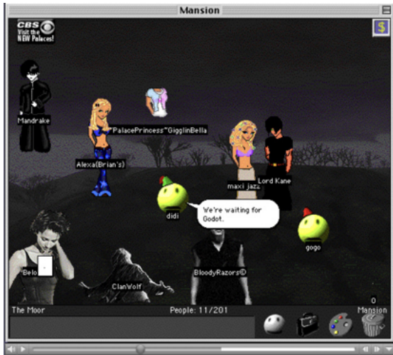
Figure 6. Waiting for Godot