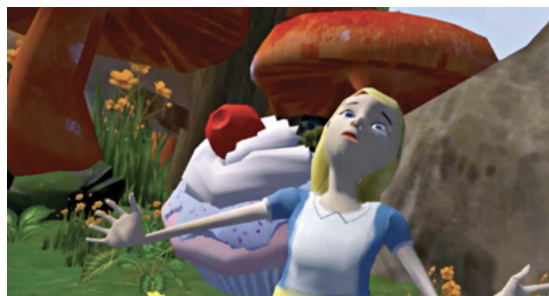
Figure 3. Holojam in wonderland

Façade est un « drame interactif » en un acte, librement inspiré de la pièce « Qui a peur de Virginia Woolf ? » d'Ed-