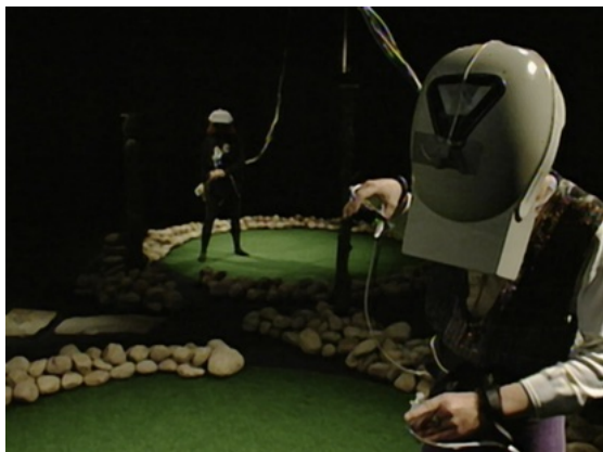
Figure 1. Placeholder.

Placeholder était une expérience de théâtre en réalité virtuelle mise en scène par Brenda Laurel et Rachel Strickland au Banff Centre en 1992. C'était une production de Interval Research Corporation et du Banff Centre for The Performing Arts. La pièce explorait une nouvelle forme d'action narrative à plusieurs personnes dans un monde virtuel [38].