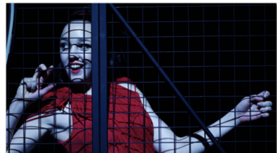
Figure 9. AI : when a robot writes a play (c) THEaiTRobot

On peut inclure également certains travaux récents qui utilisent l'IA générative pour écrire des pièces de théâtre. C'est le cas par exemple de "AI : when a robot writes a play", pièce de théâtre écrite par chatGPT-2 dans le cadre du projet de recherche THEaiTRobot et interprétée sur une scène physique par des acteurs vivants [1]. La première a eu lieu le 26 février 2021 à Prague, dans une mise en scène de Daniel Hrbek [29]. Ce n'est pas la première fois qu'un texte de théâtre est écrit à l'aide de l'intelligence artificielle. C'était déjà le cas de la comédie musicale "Beyond the Fence" en 2016 [14, 45] et de la pièce de théâtre "Lifestyle of the Richard and Family" mis en scène par Harriett Gillies en 2018 [35]. D'un point de vue artistique, ces productions sont plus des "coups médiatiques" ou des prises de position politique que des oeuvres originales. En revanche, elles alimentent un courant de recherche très actif et intéressant sur la génération automatique de textes dramatiques [21, 46].