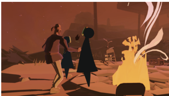
Figure 7. The under presents : The tempest (c) Tender Claws

Plus récemment, on a vu apparaître des expériences de théâtre mises en scène dans et pour les métavers. The Under Presents The Tempest est une pièce de théâtre originale écrite et mise en scène par Samantha Gorman, librement inspiré de La tempête de Shakespeare [48, 18, 7, 16, 66]. Acteurs et spectateurs portent des casques de réalité virtuelle, et se connectent à distance, comme dans un jeu en ligne. Par rapport à l'ère précédente, les graphismes et les animations s'améliorent mais restent limités.