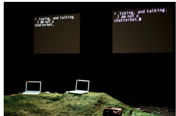
Figure 8. Hello hi there (c) Annie Dorsen

Le théâtre algorithmique est une approche assez différente des précédentes, où l'accent est mis résolument sur la création d'une pièce et de sa mise en scène intégralement par ordinateur. Un exemple emblématique est "Hello Hi There", pièce de théâtre pour deux ordinateurs écrite et programmée par Annie Dorsen en 2010 [24, 39].