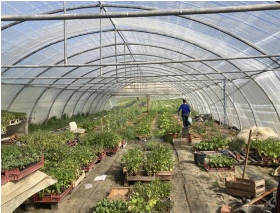
Figure 3 - Aurélie, installée en maraîchage

Cela ne remet pas forcément en cause la division sexuée du travail agricole. Dans ces collectifs mixtes, les femmes demeurent peu impliquées dans la production. Certaines tâches, découlant de leur assignation domestique (préparer les repas lors d'événements, nettoyer et préparer l'exploitation en amont, être disponible en renfort, etc.) continuent d'être inégalement réparties, sans que l'on sache précisément si elles les subissent ou non.